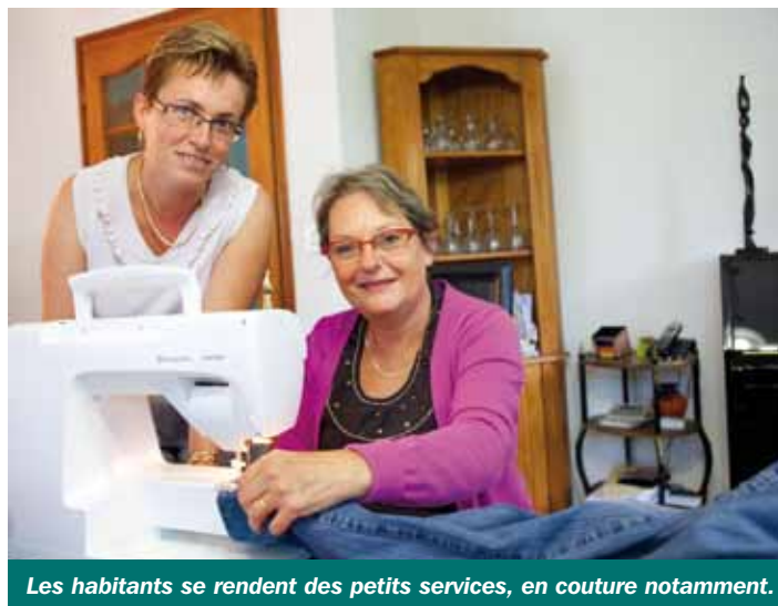
Les habitants se rendent des petits services, en couture notamment.