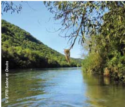
Le Doubs dans le secteur de Deluz et Vaire-Arcier.