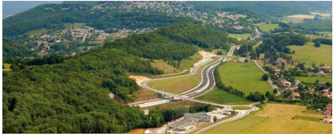
La nouvelle route passe, entre autre, à côté de La Vèze (à droite) et a ouvert le 12 juillet aux automobilistes.

Coût : 160,9 M€, financés par l'Etat (29,8%), le Conseil général du Doubs (23,8%), le Conseil régional (23,8%) et le Grand Besançon (22,6%)