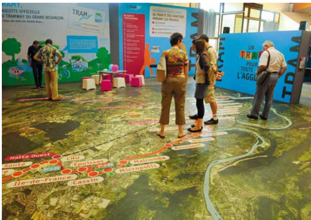
Le projet de première ligne de tramway du Grand Besançon, tel que présenté à la Foire Comtoise, a obtenu sa DUP.