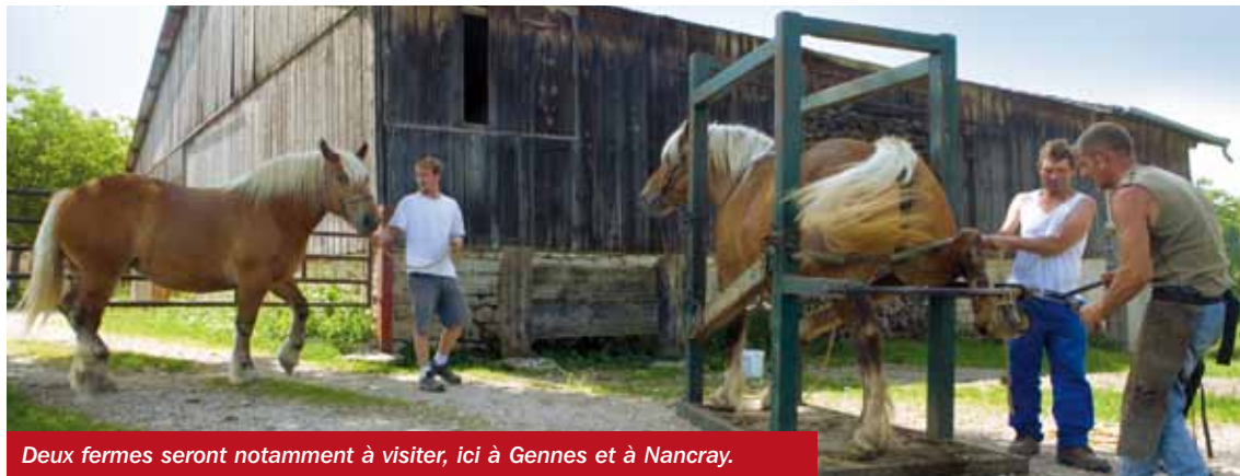
Deux fermes seront notamment à visiter, ici à Gennes et à Nancray.

Proposer aux habitants en milieu urbain de se rapprocher du milieu rural par des rencontres, des visites de ferme en ferme, la découverte du patrimoine et des espaces naturels: tel est l'objectif de la seconde édition de « Parties de campagne », organisée par le Grand Besançon le samedi 3 septembre prochain, à Saône, Gennes et Nancray. Pour