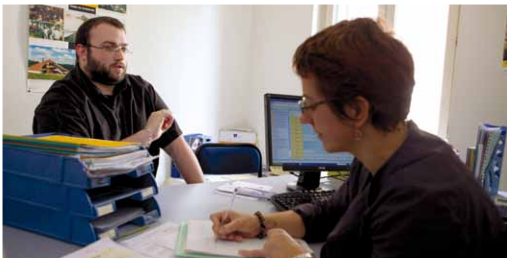
Entretien à la Mission Locale.

Ce constat impose d'imaginer transversalement et collectivement (associations, entreprises, collectivités...), des solutions pragmatiques qui viennent compléter ou optimiser les dispositifs d'aide ou d'accompagnement existants.