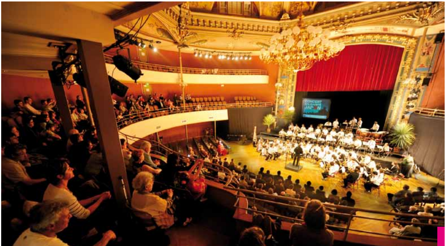
Grâce au concert donné par les orchestres du Conservatoire à rayonnement régional et organisé au profit des victimes du tsunami au Japon (le 4 mai), la somme de 12015 € a été récoltée. Elle comprend les recettes des associations ainsi que l'apport du Grand Besançon.