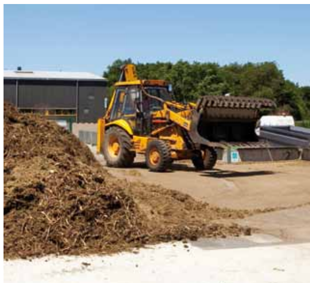
Les déchets verts ont une deuxième vie.

Le traitement des déchets est une des préoccupations du Grand Besançon qui s'attache à trouver des solutions pour relocaliser cette activité. Une méthode innovante fait son apparition cette année : le co-compostage qui associe particuliers et agriculteurs. Les particuliers pourront apporter en déchetterie leurs déchets verts à déposer sur une plate-forme spécialement conçue. Puis, les végétaux seront broyés et livrés à un agriculteur partenaire dans un rayon de 10 km maximum. Ce dernier mélangera le broyat avec du fumier pour créer un nouveau compost plus riche à étendre sur ses terres. Cette nouvelle méthode permettra de réduire les distances parcourues par les camions du SYBERT*. Les sites de Thoraise et d'Epeugney seront les premiers équipés.