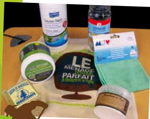
Un kit de nettoyage sans toxique.

Du vinaigre blanc (détartrant, dégraissant, adoucissant), du savon noir (nettoie tout du sol au plafond), de la pierre d'argile blanche (poudre à recurer), des lingettes microfibrées (pour ne plus jeter de lingettes imprégnées de produits chimiques), du bicarbonate de soude (désodorisant, adoucissant...) et du savon de Marseille.