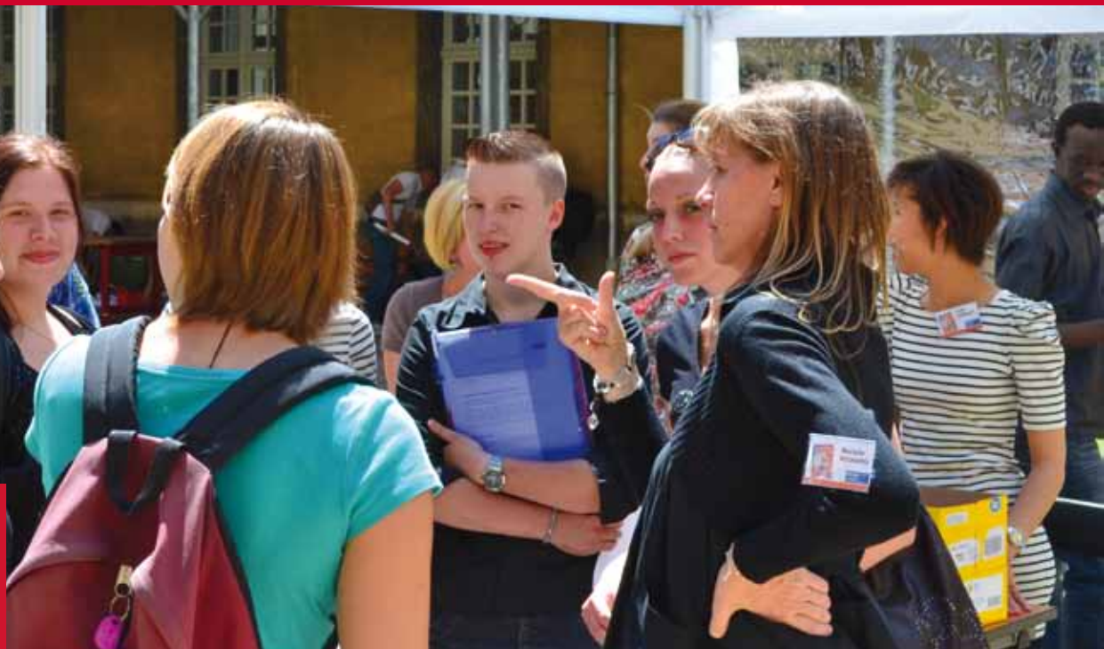
Grâce à la Mission locale, le Grand Besançon est acteur majeur de l'insertion des jeunes sur le territoire.

Recenser, analyser les besoins des jeunes et leurs préoccupations, pour mieux les prendre en compte au sein des politiques menées sur le territoire du Grand Besançon, c'est précisément le travail que le Conseil de Développement Participatif du Grand Besançon (CDP) a réalisé en partenariat avec la Ligue de l'enseignement et le soutien du sociologue Christian Guinchard. Le CDP a élaboré une plaquette intitulée « Paroles de jeunes » qui recueille les points de vue, les inquiétudes, les attentes des moins de 26 ans. Ce document prospectif, nourri de témoignages, de constats et de préconisations dans divers domaines (l'argent, le transport, la culture et l'emploi) a dernièrement été remis aux élus et acteurs de la jeunesse du Grand Besançon. Ce document démontre que par ses actions et politiques, le Grand Besançon prend déjà en compte un certain nombre de besoins exprimés par les jeunes. Il en découle aussi des pistes de réflexion et de travail supplémentaires, pour les élus comme pour les acteurs concernés, qui doivent participer au mieux-être de cette composante de la population, notamment des 16-25 ans.