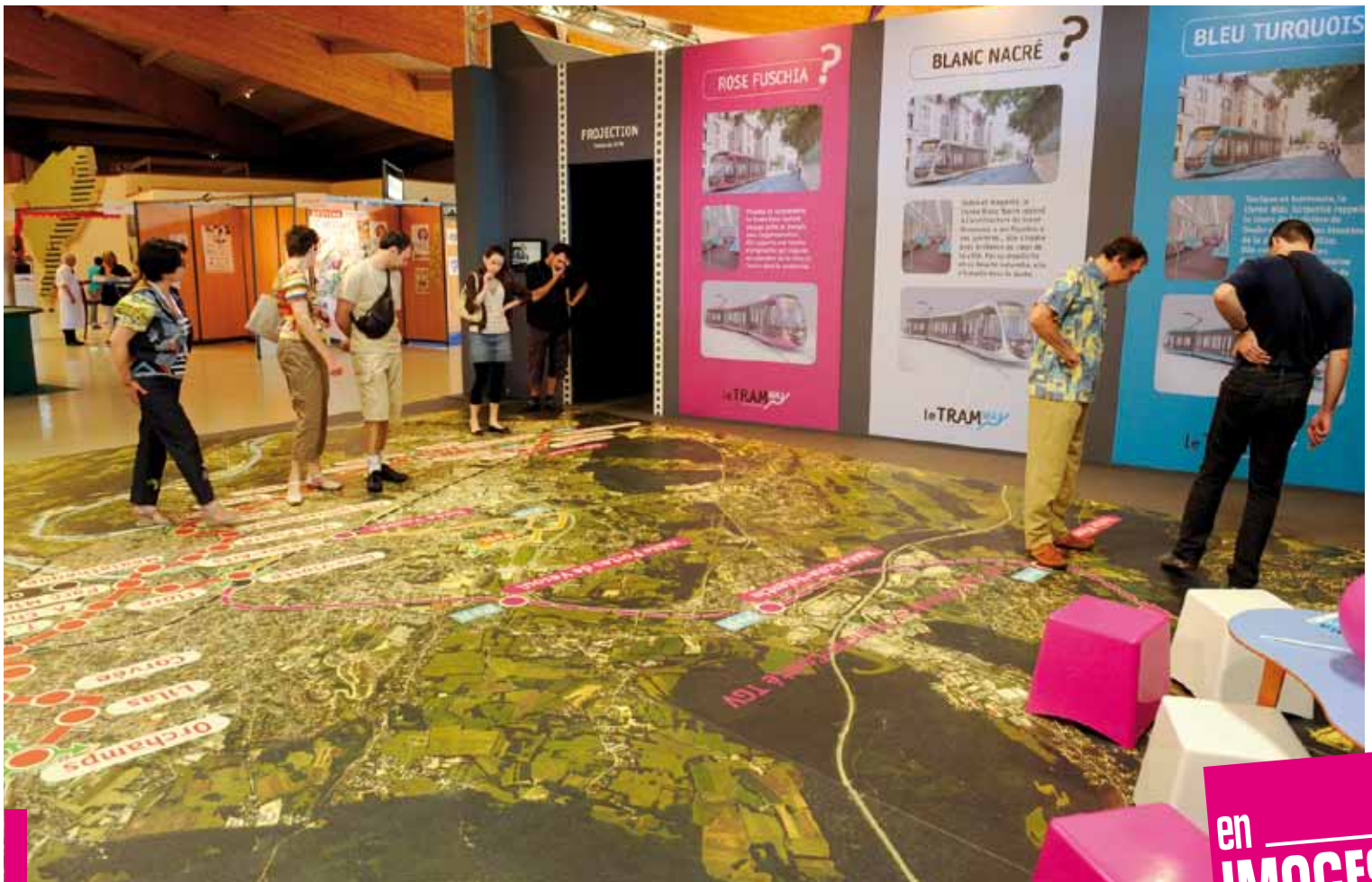
Lors de la Foire comtoise, de nombreux Grand Bisontins sont venus sur le stand du tramway pour découvrir le projet phare de l'Agglomération et se prononcer sur la couleur du tram. Il sera finalement bleu turquoise.