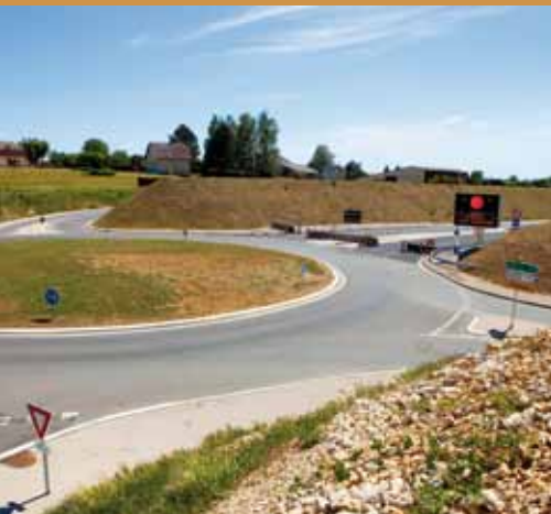
Entrée/sortie sur la voie des Mercureaux au niveau de La Vèze.

Élément clé du désenclavement de l'agglomération vers le Haut-Doubs et la Suisse, vers le nord Franche-Comté et le Grand Est, enfin vers le Jura et Lyon, la Voie des Mercureaux participe à la fluidification des flux automobiles dans le Grand Besançon. Elle inaugure également pour notre territoire l'accès plus direct et plus rapide à la dimension extrarégionale, à l'espace métropolitain Rhin-Rhône, aux grands pôles français et aux dorsales européennes, que va encore renforcer l'arrivée imminente du TGV Rhin-Rhône, avec la gare de Besançon Franche-Comté TGV.