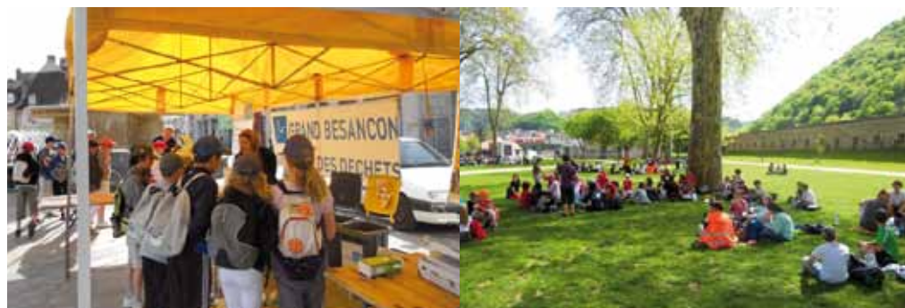
Rando urbaine avec l'Usep, les écoles et le Grand Besançon. Au programme : sensibilisation au tri et pique-nique sans déchet.