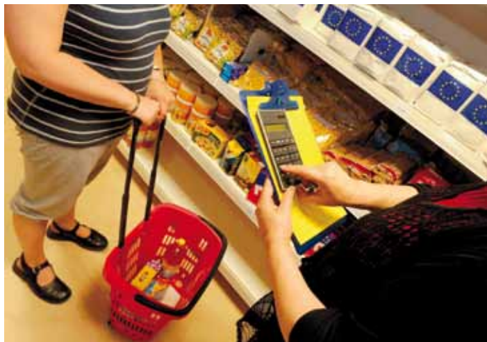
« Le p'tit marché » est devenu « Le panier solidaire ».