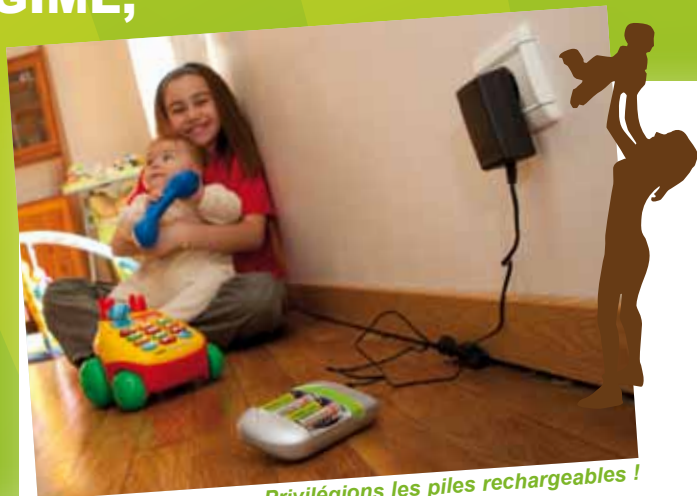
Privilégions les piles rechargeables !

UN RENSEIGNEMENT ? Contacter le SYBERT par mail à secretariat.sybert@sybert.fr ou au 03 81 65 02 38.