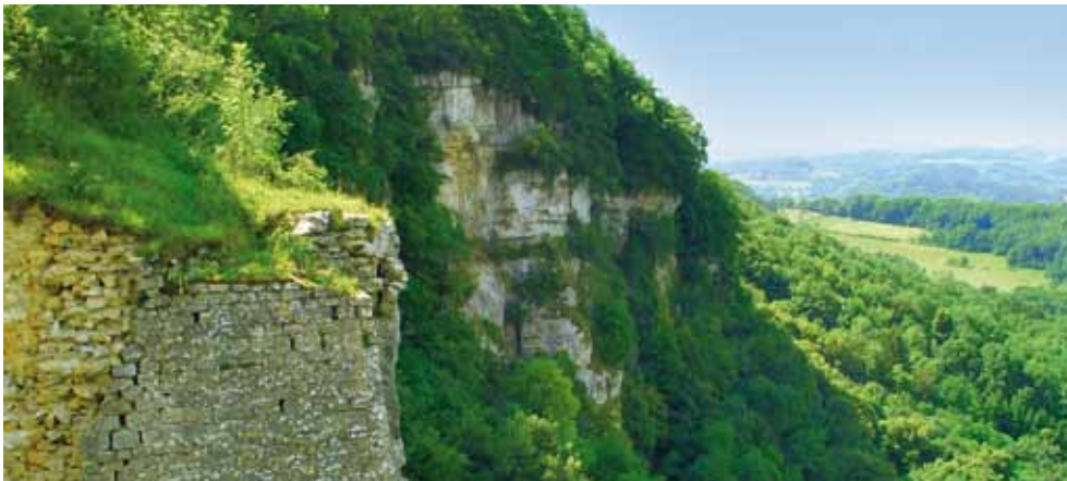
Falaise à Montfaucon où niche le faucon pèlerin.