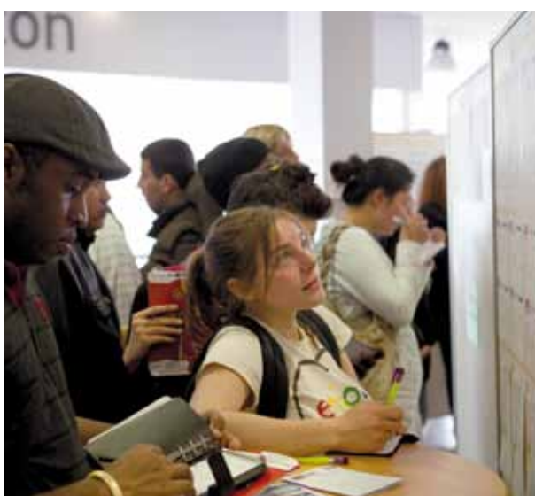
Les petites annonces sont prisées auprès des jeunes.