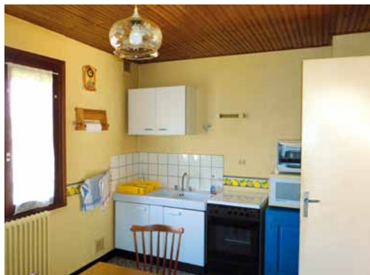
L'association HDL est chargée de vous apporter une aide et des conseils.

■ HDL, 30 rue du Caporal Peugeot, 25000 Besançon. Tél. 03 81 81 23 33