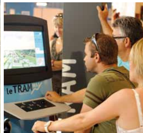
Les futurs usagers ont pu découvrir le tracé sur des bornes interactives.