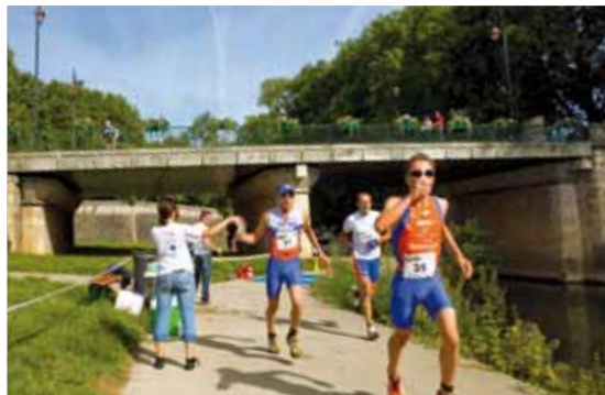
Près de 300 athlètes ont participé à la manifestation sportive organisée le 12 juin.

Le triathlon de Besançon s'appelle désormais le triathlon Vauban car le parcours s'étire au pied de la citadelle. Les dirigeants du club ont pu associer leur manifestation au nom de Vauban dont les fortifications bisontines ont été classées au patrimoine mondial de l'Unesco en 2008.