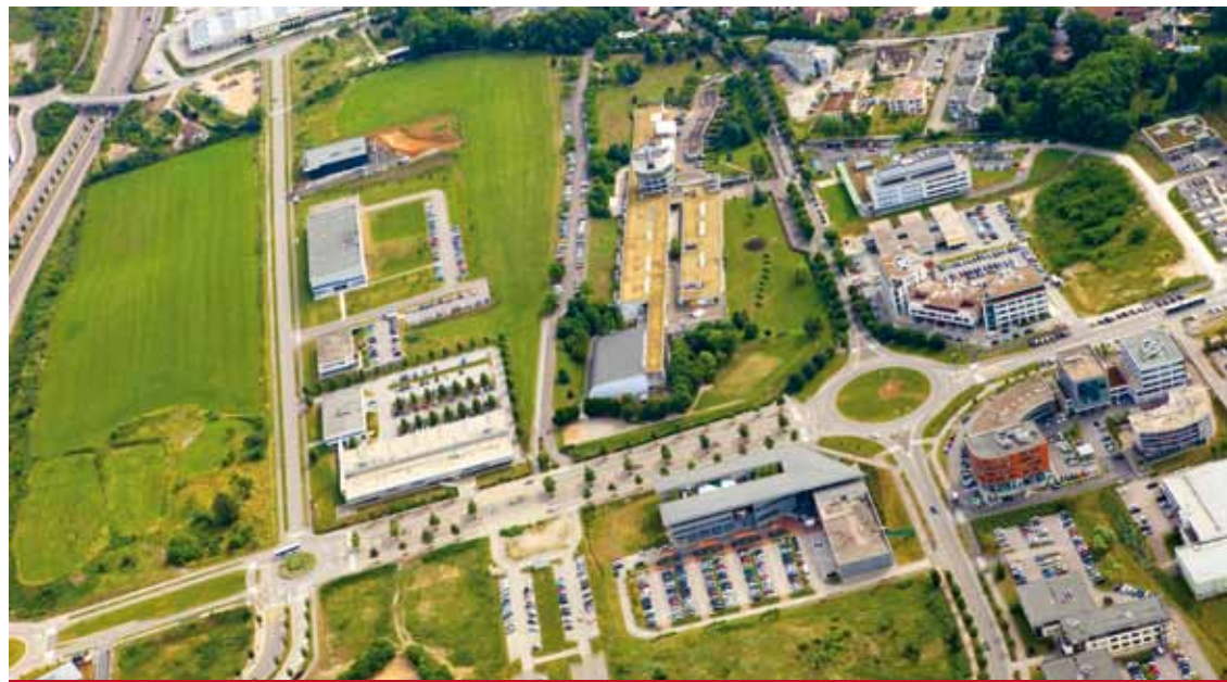
Les filiales bisontine et belfortaine de Mecasem sont installées à Temis.

Début 2011, le groupe MECASEM, spécialisé dans le contrôle, la mesure, la métrologie et les essais industriels, a regroupé sur la Technopole de TEMIS, ses filiales bisontine et belfortaine pour recentrer son pôle Métrologie accrédité COFRAC (Comité français d'accréditation), dans un environnement dédié aux microtechniques. Une dizaine de