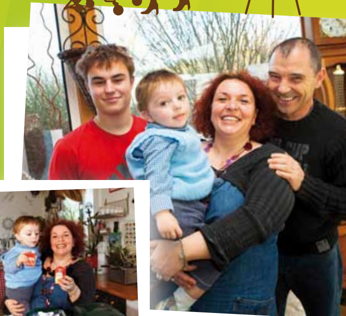
La famille Guillaume de Saône.