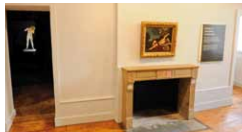
Quelque 75 œuvres dont 41 peintures à admirer depuis le 2 juillet.

■ Musée Courbet, place Robert Fernier, 25290 Ornans. Tél. 03 81 86 22 88 et www.musee-courbet.fr