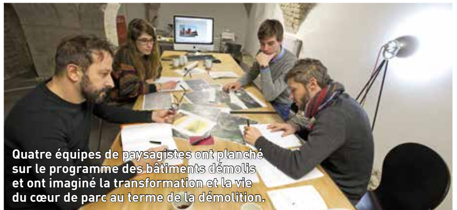
Quatre équipes de paysagistes ont planché sur le programme des bâtiments démolis et ont imaginé la transformation et la vie du cœur de parc au terme de la démolition.

C et été seront lancés, pour deux ans, les travaux de démolition des anciennes usines de la Rhodiacéta fermées depuis 1982. Le désamiantage précèdera les premiers coups de pelle et de brise-béton. Pour imaginer le devenir du site et envisager la conservation potentielle de traces symboliques du passé industriel et des luttes sociales qui l'ont animé, la municipalité a sollicité quatre équipes de paysagistes : Latitude Nord, MAP (Métropole Architecture Paysage), Territoires Landscape Architects et Orizhome.