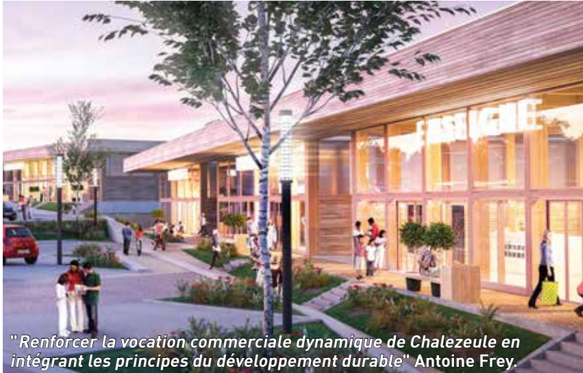
"Renforcer la vocation commerciale dynamique de Chalezeule en intégrant les principes du développement durable" Antoine Frey.