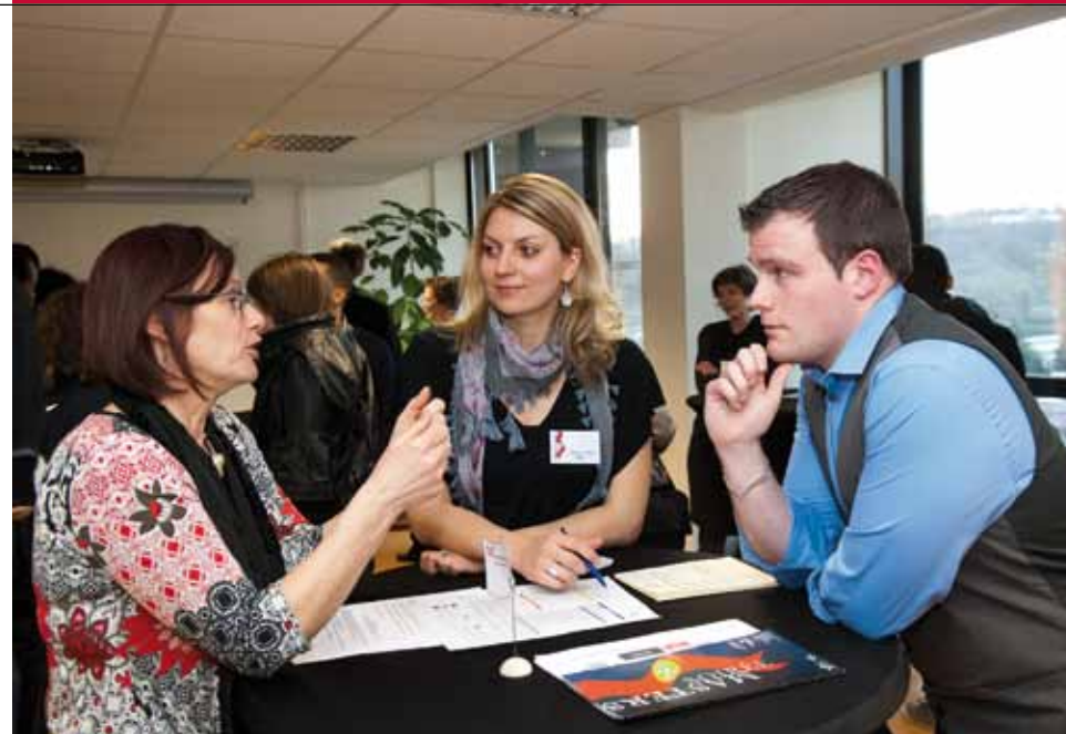
UNE SOIRÉE TRÈS POSITIVE QUI EN APPELLE D'AUTRES. ▶

En mai, l'Europe et la solidarité internationale sont à l'honneur au CRIJ. Du 9 au 14 mai, en lien avec la journée de l'Europe : informations, documentations et expositions seront proposées pendant toute la semaine, ainsi qu'un temps fort le mardi 10 avec au programme : conseils, échanges, débats avec des organismes et de jeunes Européens. Le 25 mai , sera consacré à la solidarité internationale en partenariat avec le Cercoop et Récidev. La journée sera l'occasion de vous informer, de comprendre les grandes questions d'aujourd'hui, de découvrir différentes manières d'agir pour un monde solidaire et de connaître les acteurs de la solidarité internationale. Différentes structures se relaieront au cours de la journée pour échanger et répondre à vos questions. Plus de renseignements sur www.jeunes-fc.com ou en appelant le CRIJ au 03 81 21 16 16.