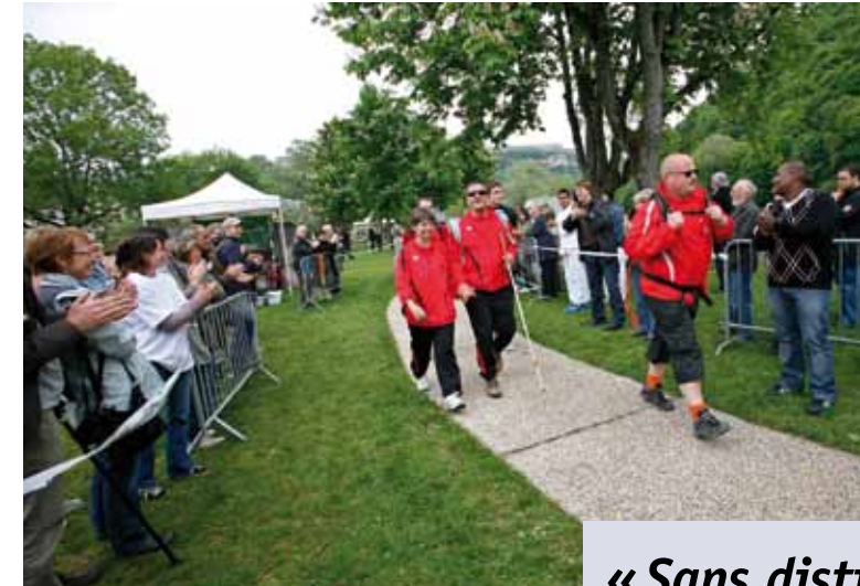
SOUS LES APPLAUDISSEMENTS, L'ÉQUIPE DES SALINS DE BREGILLE FRANCHIT LA LIGNE D'ARRIVÉE.

ENTRAIDE. Véritable aventure humaine, le raid Handi'Forts réunit personnes handicapées et valides pour deux jours de partage et d'efforts.