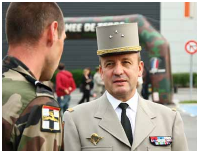
TÉMOIGNER, COMMUNIQUER, EXPLIQUER LE RÔLE DE L'ARMÉE, UNE MISSION CHÈRE AU GÉNÉRAL DE BAVINCHOVE.

Un souci permanent anime l'armée, celui de témoigner de ses nombreuses missions. Un besoin de rayonnement nécessaire qui se traduit par des actions permanentes, qu'il s'agisse de l'implication de la réserve citoyenne ou des nombreuses prises d'armes qui se déroulent régulièrement pendant l'année... Des actions ponctuelles ont également lieu, pendant les journées du patrimoine, les parcours de la mémoire, des témoignages dans les établissements scolaires, ou, plus récemment, la Journée défense et citoyenneté, organisée la veille du match de rugby entre la France et l'Irlande, dont le but fut de montrer l'importance de la citoyenneté et des bienfaits du sport dans la vie en société. De nombreuses et diverses actions qui entretiennent régulièrement le lien profond qui unit les forces armées à la ville.