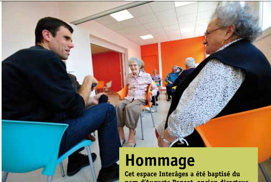
▲ 180 M 2 DÉDIÉS À LA THÉMATIQUE INTERGÉNÉRATIONNELLE.

Cet espace rénové dans un style sixties mais avec le confort et l'ergonomie d'aujourd'hui, accueillera dès 8 h 40 le lundi 2 la Ligue de l'enseignement pour une lecture de l'actualité ouverte à tous, et à partir de 14 h, les aînés du Club des amitiés de Saint-Claude pour un loto. Enfin, à 18 h, l'Association solidarité Saint-Claude (ASS) convie les habitants à une rencontre. Le mardi 3 sera, lui, consacré aux résidents, en matinée pour une séance de gym, puis aux seniors du quartier pour un après-midi jeux. Le mercredi 4, place aux enfants avec l'accueil