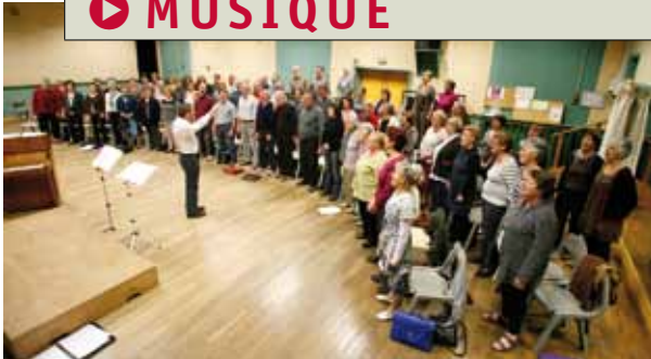
◀ 30 BOUGIES À SOUFFLER POUR LA CHANTOILLOTTE.