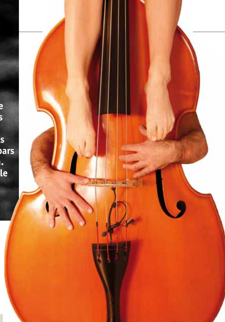
▲ DÉBROUSSAILLER LES SENTIERS BATTUS, FAIRE GRANDIR LES JEUNES POUSSES DE DEMAIN, DÉNICHER QUELQUES HERBES FOLLES : ÇA, C'EST ÉMERGENCES.