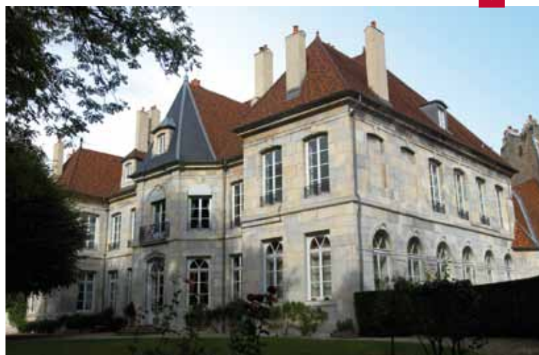
L'HÔTEL DE GRAND QUARTIER GÉNÉRAL DE CLÉVANS, LIEU CHARGÉ D'HISTOIRE ET ESPACE DE RENCONTRES PRIVILÉGIÉ ENTRE CIVILS ET MILITAIRES. ▼