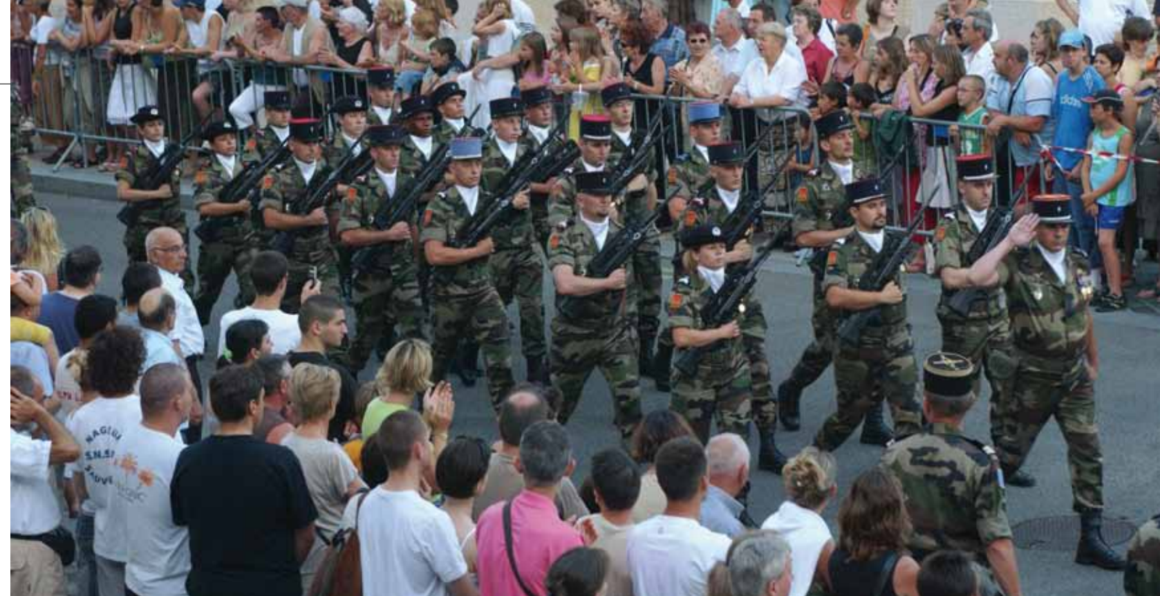
DIX CÉRÉMONIES COMMÉMORATIVES SONT ORGANISÉES CHAQUE ANNÉE.

toujours eu dans cette ville les éléments permettant d'en asseoir l'importance au plan militaire. Cette place forte très ancienne, conquise par Louis XIV, a toujours été une ville prépondérante dans le dispositif défensif de la France, tout au long des XVIII e , XIX e et jusqu'au milieu du XX e siècle. » Un passé historique prestigieux dont on retrouve les nombreuses traces à travers l'architecture, les casernes, les forts dans toute la ville, et qui explique certainement pourquoi la capitale de région est restée une garnison conséquente. « Au milieu de la réforme des armées, qui amène tout de même 54 000 militaires à quitter les rangs de la Défense, Besançon voit au contraire sa place confortée », précise le général de Bavinchove. Mais la vocation opérationnelle de la base bisontine explique également cette décision. « Les militaires présents à Besançon, qui appartiennent à l'État major de force n°1, la 7 e brigade blindée, au 19 e et au 13 e régiment du Génie, mais également au 6 e RMAT, sont fréquemment projetés sur les théâtres d'opérations extérieurs », poursuit le commandant d'Armées de la Place de Besançon.