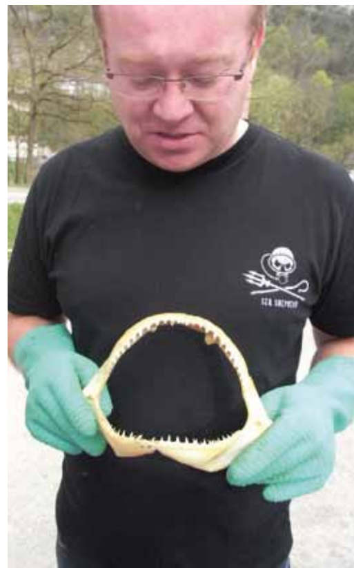
▶ UNE NOUVELLE VERSION BISONTINE DES "DENTS DE LA MER".

Organisée par l'UFC, la 2 e édition de la Soirée Masters à destination des étudiants de L3 et M1 visait à mettre en valeur les diplômes d'excellence et l'ouverture sur le monde socio-économique régional. L'affluence des étudiants, anciens et nouveaux, a triplé d'une année à l'autre et la participation des responsables des formations s'est renforcée, le tout en présence des représentants des mondes politique et économique. Dans une ambiance détendue et conviviale, témoignages, retours d'expériences et échanges, sur fond d'animations originales, ont séduit et convaincu l'assistance de la pertinence d'un tel événement. Rendez-vous est déjà pris pour l'an prochain ! ■