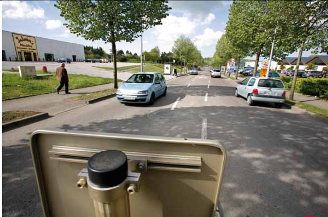
D'ICI NOVEMBRE, LA RUE RENÉ CHAR VA SUBIR DE PROFONDES TRANSFORMATIONS.

VOIRIE. Deux nouveaux chantiers d'importance démarrent en mai : l'aménagement de l'entrée du CHU et de la rue René Char.