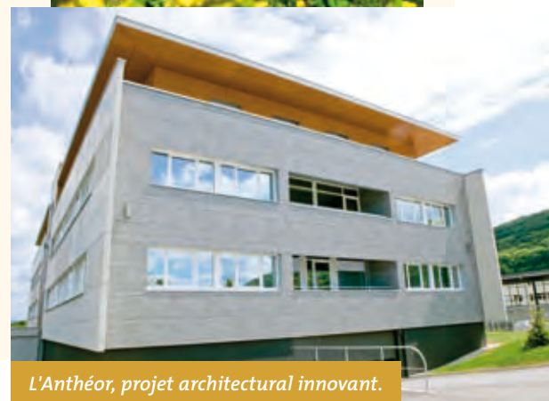
L'Anthéor, projet architectural innovant.