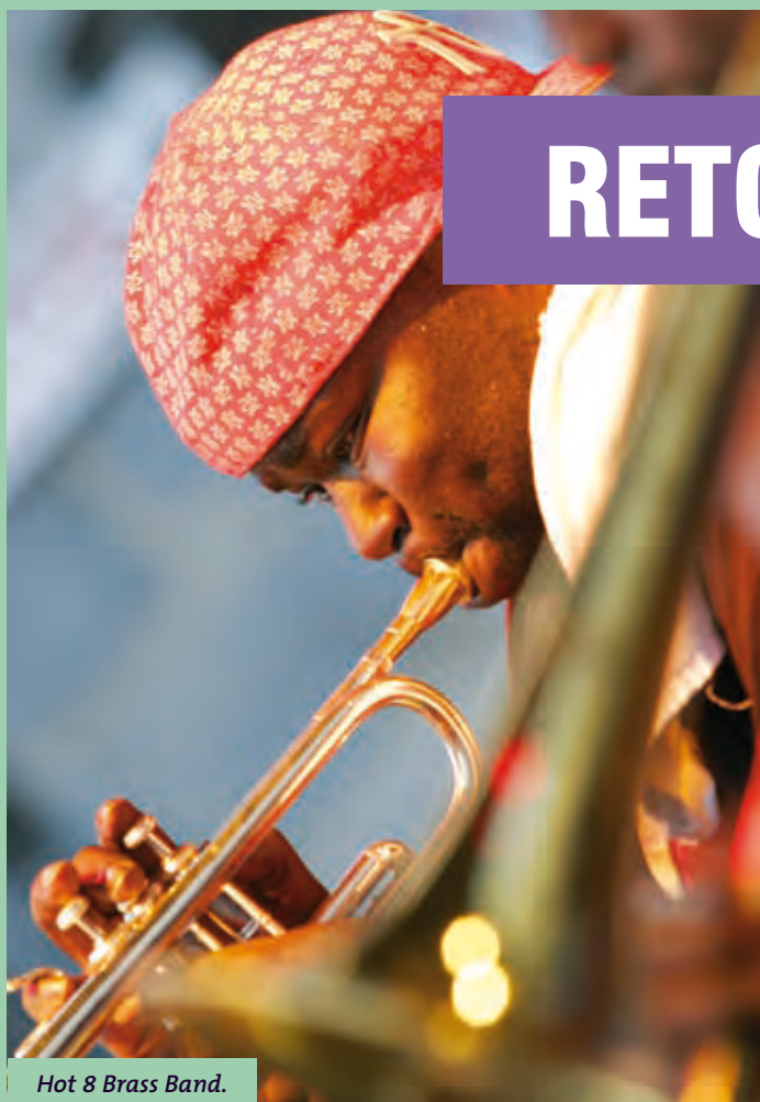
Hot 8 Brass Band.

sur une ambiance, et une volonté de donner un accès simplifié vers la musique. » Une étude a révélé que 70 % des personnes présentes au festival ne vont jamais voir de concerts en temps normal, Musiques de Rues assume également son rôle de manifestation pédagogique pour un nouveau public, et continue d'attiser les curiosités pour guider les spectateurs vers la création.