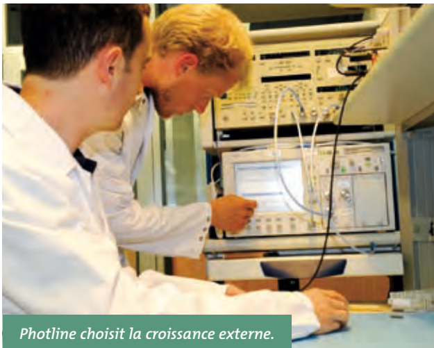
Photline choisit la croissance externe.

Nouvelle étape dans la croissance de Photline Technologies, fabricant de modulateurs optiques à Besançon : l'entreprise a annoncé au mois de juin sa fusion avec la société Adlightec, basée dans les Côtes-d'Armor et spécialisée dans l'électronique rapide. Grâce à la combinaison de son savoir-faire avec Adlightec, Photline prévoit une amélioration de ses performances dans le domaine des télécoms optiques et l'élargissement de sa clientèle, principalement en direction des industries de la défense et de l'espace.