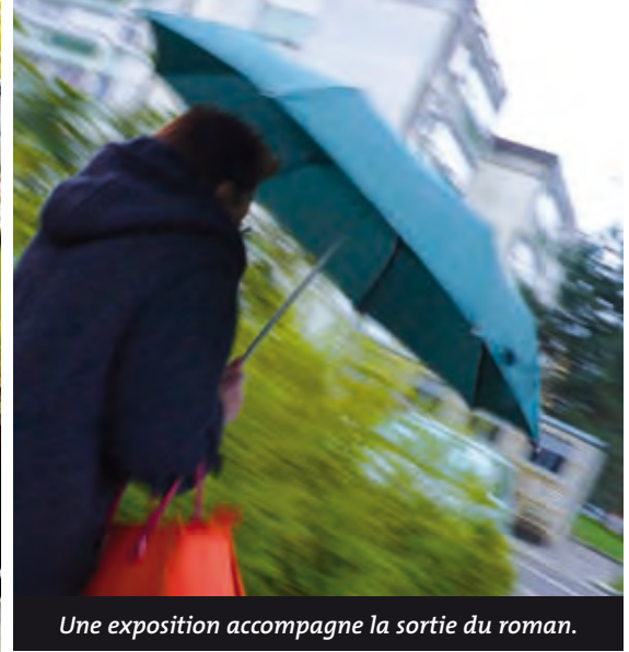
Une exposition accompagne la sortie du roman.

Grand Prix des lectrices de Elle 2008 pour son livre « Garden of Love », l'écrivain Marcus Malte était ces jours derniers au salon des Mots Doubs avec son tout nouvel ouvrage « Poser ma besace à Besac » édité pour l'occasion. Venu en résidence à Besançon à la demande de l'association Croq'Livres, l'écrivain a animé des ateliers d'écriture, rencontré des dizaines d'adolescents de tous les quartiers de la ville. De ces moments complices, Marcus Malte a imaginé ce petit roman qui emmène le lecteur dans une enquête, de Planoise aux Clairs-Soleils en passant par la Boucle. En parallèle,