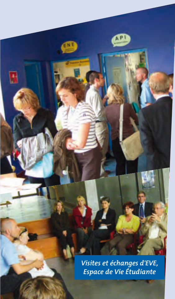
Visites et échanges d'EVE, Espace de Vie Étudiante