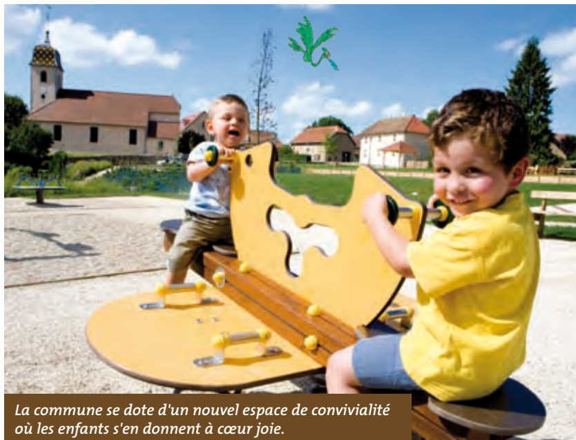
La commune se dote d'un nouvel espace de convivialité où les enfants s'en donnent à cœur joie.