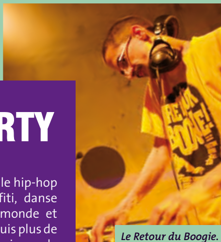
Le Retour du Boogie.

Né dans le Bronx à New York, le hip-hop et ses disciplines (rap, graffiti, danse et deejaying) traversent le monde et bouleversent les époques depuis plus de 30 ans. Logique donc que Musiques de Rues s'en fasse l'écho : pour la 3e année consécutive, les "B-Boys" (et "B-Girls") de Besançon prendront la ville d'assaut au cours d'une "block party" géante. Go DJ!