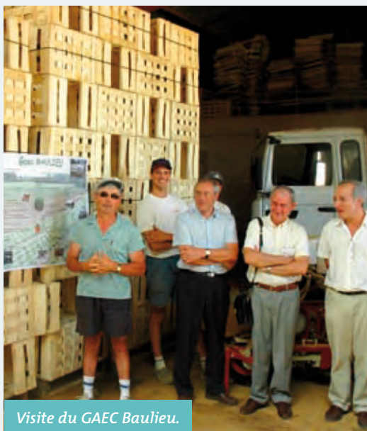
Visite du GAEC Baulieu.

L'association nationale "Terres en Villes" qui travaille sur la problématique de l'agriculture et de la forêt en zone périurbaine a tenu son assemblée générale à Besançon au début de l'été. Quel devenir pour l'agriculture autour des villes ? Cette question est l'une des constantes de ce réseau qui regroupe 18 territoires, tous représentés par une agglomération et une chambre d'agriculture. Adhérents depuis un an, le Grand Besançon et la Chambre d'agriculture du Doubs avaient concocté la visite de trois sites et entreprises pour la soixantaine de participants venus débattre, échanger des savoir-faire, comparer les problématiques et co-construire un programme d'actions. La pérennité d'une entreprise agricole fut posée avec le GAEC Baulieu à Franois, exploitation laitière et légumière qui a dû déménager deux fois en raison de l'urbanisation. La question du développement de circuits courts, abordée avec les producteurs de la fruitière de Fontain et les organisateurs du marché de Pugy ou celle de l'aménagement agricole et