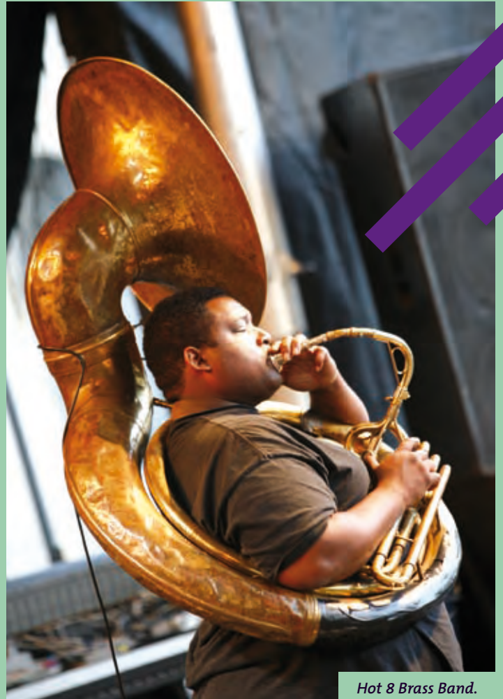
Hot 8 Brass Band.