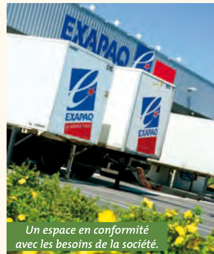
Un espace en conformité avec les besoins de la société.

Sur le site de TEMIS , l'Union des Industries des Métiers de la Métallurgie a ouvert les portes de la Maison de l'Industrie. Son rôle : du conseil et de la formation pour accompagner les entreprises dans leur développement. Avec un amphithéâtre et des salles de réunions sur 1200 m 2 , la Maison de l'Industrie aspire à devenir « un lieu d'échanges, de débats et de réflexion pour les dirigeants et les salariés », comme l'a souligné Etienne Boyer, président de l'Union, lors de l'inauguration.