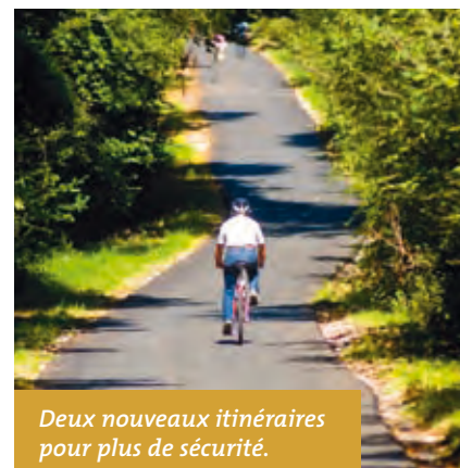
Deux nouveaux itinéraires pour plus de sécurité.

Le Grand Besançon vient de financer des travaux d'aménagement sur deux itinéraires cyclables autour des forêts bisontines, à l'Est et à l'Ouest de Besançon. Entre Serre-les-Sapins et les Tilleroyes, c'est un chemin connu des cavaliers qui vient d'être transformé en piste cyclable, avec un nouveau marquage au sol et un jalonnement. Montant de l'opération : 70 000 €. À l'est de Besançon, les travaux sont encore en cours sur le chemin du Roi à Thise, qui fait le lien entre la commune de Braillans et la forêt de Chailluz. Plus coûteuse, l'intervention porte sur l'aménagement d'un nouveau revêtement pour un circuit sécurisé qui reliera la forêt de Chailluz à la commune de Braillans. L'itinéraire sera praticable dès l'automne.