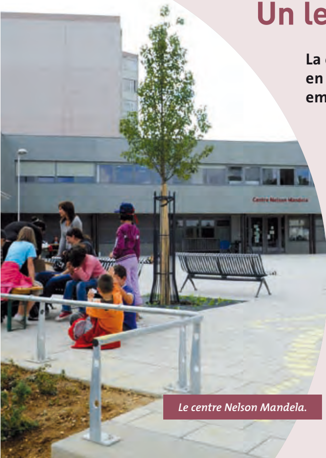
Le centre Nelson Mandela.