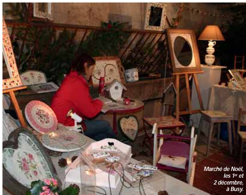
Marché de Noël, les 1 er et 2 décembre, à Busy.