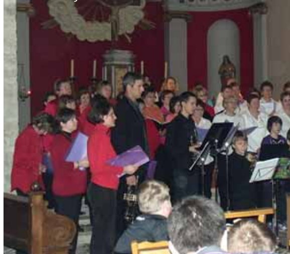
Chants de Noël, les 4, 11 et 18 décembre, à Avanne-Aveney.