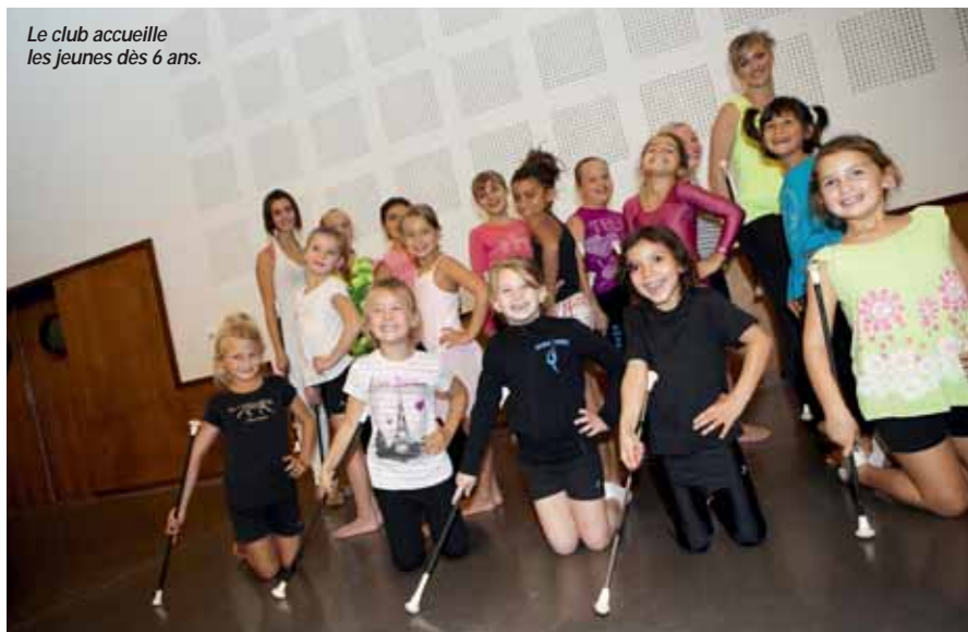
Le club accueille les jeunes dès 6 ans.

L'entraînement a repris avec la ferme ambition d'améliorer encore la performance et d'intégrer, qui