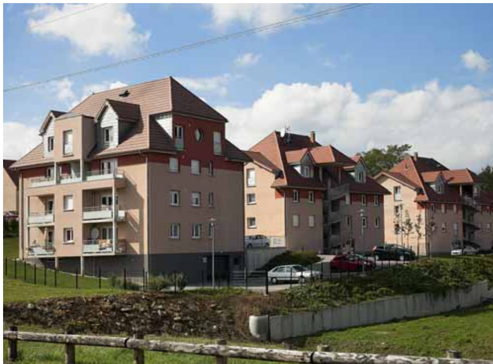
Le Grand Besançon accompagne les communes, comme ici à Pirey, dans la révision de leur plan local d'urbanisme.

Parmi les priorités du SCoT, le renforcement