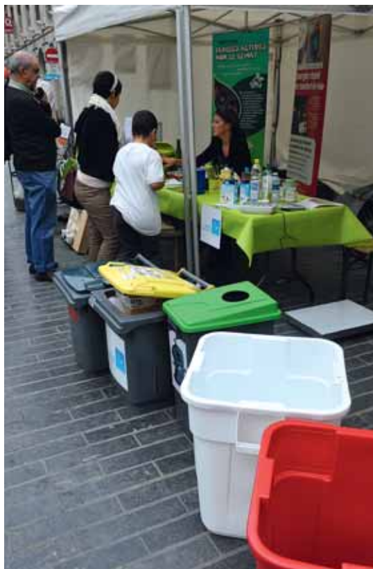
Il n'est jamais trop tard pour acquérir les bons gestes en participant à un atelier.