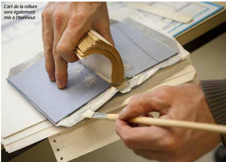
L'art de la reliure sera également mis à l'honneur.

Châtillon-le-Duc, centre Bellevue 23 et 24 mars de 14h à 18h. Entrée libre