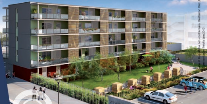
Illustration CALLERANG © Neolia - 2013

► Appartements T2 au T4 * Résidence avec parc agrémenté d'arbres fruitiers Entrée indépendante • Parking privatif et garage fermé