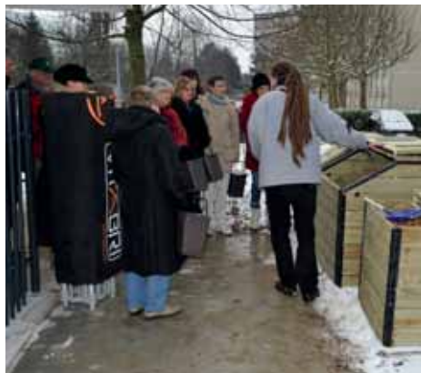
Le compostage collectif fait partie des actions qui permettent d'atteindre les objectifs fixés.

« Les déchets au régime » (waste on a diet) est un projet soutenu par l'Union européenne à travers son programme « L'instrument financier pour l'environnement + » (LIFE+). Le Sybert, en charge du traitement des déchets, bénéficie d'un soutien de 1,8 M€ pour mener à bien ce projet d'ici juin 2015: réduire le volume des ordures ménagères résiduelles de 25% afin de se passer de l'un des deux fours d'incinération de Besançon. Pour y parvenir, chacun doit recycler et composter le plus possible afin d'atteindre 55% de recyclage (38% en 2009). Plusieurs actions sont déjà en cours: trois chalets de compostage collectif ont été installés dans les quartiers bisontins des Chaprais et de Planoise, chacun pouvant recycler jusqu'à 20 tonnes de biodéchets par an. Des séances de sensibilisation à la réduction des déchets en habitat collectif ont aussi débuté sur le gaspillage alimentaire, le réemploi, les vertus du compostage... À suivre... et à appliquer!