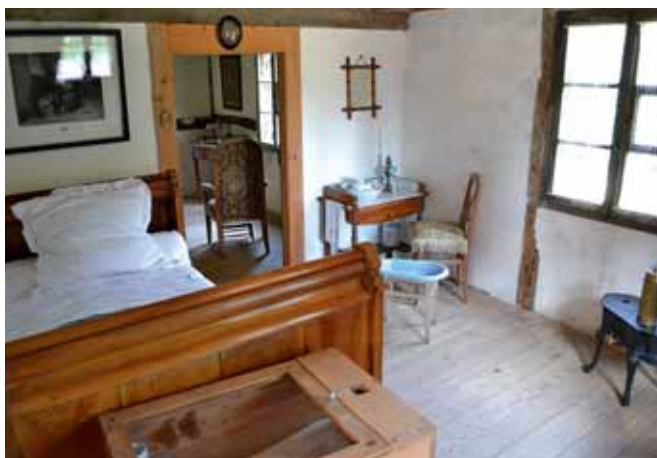
MUSÉE DES MAISONS COMTOISES

graphique, soit chronologique. Techniques des constructions et évolution des modes de vie de 1770 à 1950, la visite chemine dans l'histoire et le patrimoine rural de la région. Pour la réouverture du site le samedi 16 mars, 6 des 15 maisons ont été revues sur le plan muséographique, telles la ferme de Recouvrance ou celle de Boron. La ferme de Joncherey, du Sundgau