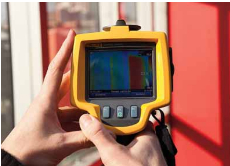
Caméra thermique (à gauche) et relevé de température (à droite) permettent d'analyser les points faibles du bâtiment.