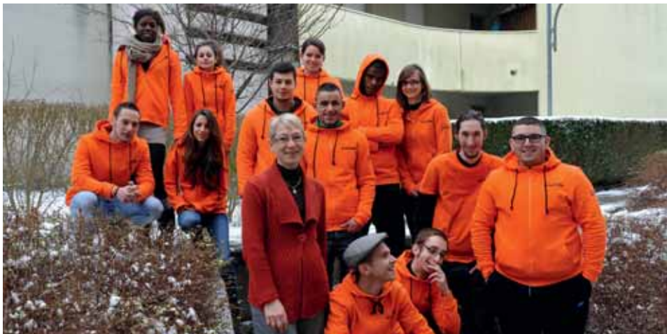
Les jeunes ambassadeurs, très volontaires, prennent leur mission à cœur, avec bonne humeur.

Dans le cadre du service civique, seize jeunes sillonnent les foyers de l'agglomération pour informer les habitants sur le compostage collectif.