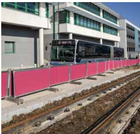
L'optimisation de la ligne de bus avec l'arrivée du tram fait partie des moyens d'améliorer le bilan carbone.