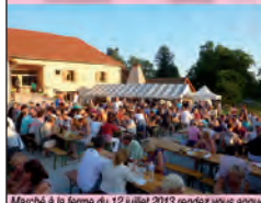
Marché à la ferme du 12 juillet 2013 rendez vous annuel tous les deuxièmes vendredis de juillet.

salades de saison, charcuteries, fromages régionaux et desserts maison... (plusieurs formules possible à votre convenance)