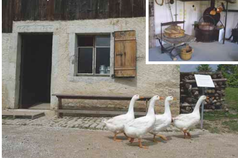
Musée de Nancray

Place du village, de 15h à 18h Rens. : 0381650653