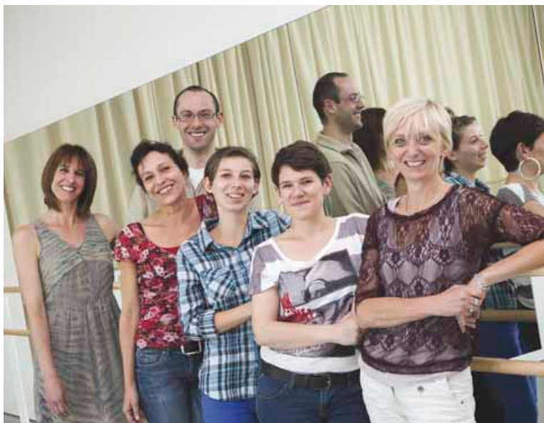
Avec les nouveaux professeurs et accompagnateurs, le Conservatoire a renforcé ses capacités d'enseignement en danse.

➔ Renseignements et inscriptions au 03 81 87 81 00