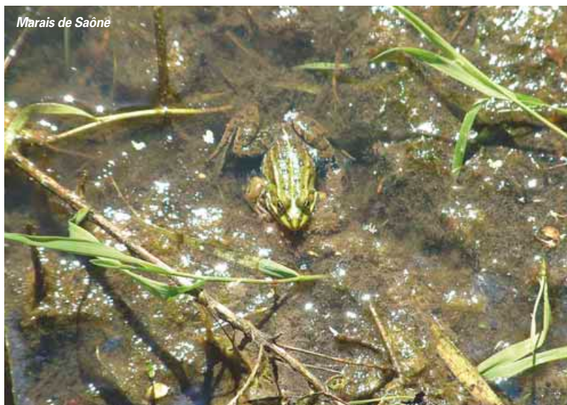
Marais de Saône