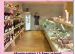
Magasin de vente à la ferme aménagé dans l'ancienne grange haute

Horaires : Mercredi : de 15h à 19h - Vendredi et samedi : de 9h à 12h et de 15h à 19h