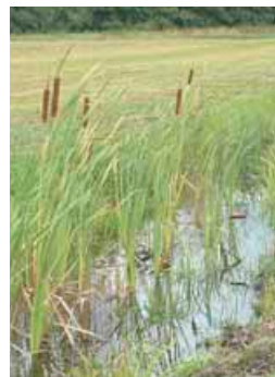
SYNDICAT MIXTE DU MARAIS DE SAÔNE

THISE Organisé par « Les lamas d'Annie ». Salle des fêtes, à 19h30 Rens. : 03 81 61 33 54