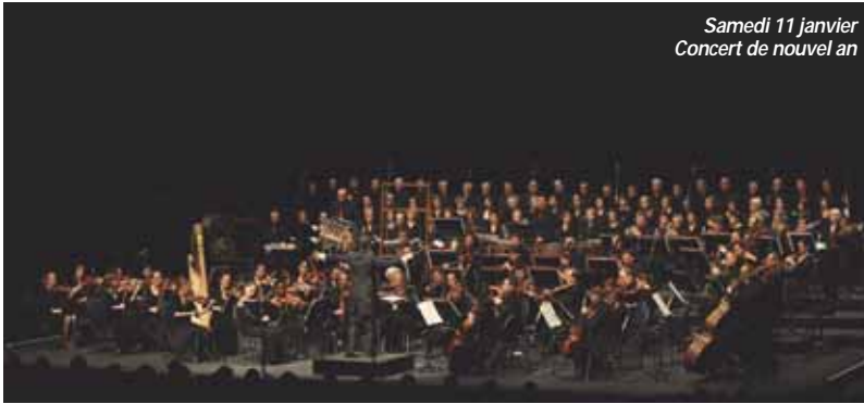
Samedi 11 janvier Concert de nouvel an