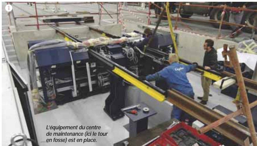
L'équipement du centre de maintenance (ici le tour en fosse) est en place.

Les semis sur la plateforme se sont achevés mi-septembre et les premières pousses sont apparues. Les deux stations du secteur sont peu à peu équipées en mobilier.