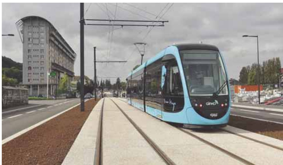
Premier passage d'un tram à Brulard le 15 octobre.

Démarrés mi-septembre, les essais sur la rame « Victor Hugo » se poursuivent dans la zone de test, aux Hauts du Chazal. En parallèle à ces contrôles poussés, depuis mi-octobre, la procédure d'ouverture de ligne s'est engagée jusqu'à la station Polygone. Durant cette phase spécifique des essais, le tram circule à allure réduite pour vérifier les voies ferrées, l'alimentation électrique, la signalisation, les écarts entre la rame et le quai, etc. A la mi-novembre, cette procédure sera élargie jusqu'à Chamars.