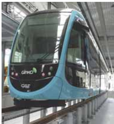
La rame Victor Hugo, en test au centre de maintenance.

Les tests en ligne, démarrés en septembre dernier aux Hauts du Chazal, permettent de valider progressivement les performances du matériel roulant, tout en vérifiant la conformité de l'infrastructure « tramway ». Mi-octobre, ces essais ont été élargis jusqu'à la station Polygone, avant d'atteindre Chamars prochainement.