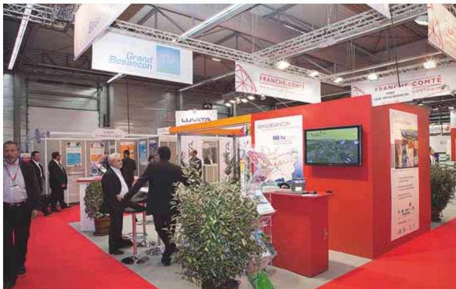
Cette année encore, le Grand Besançon sera présent sur Micronora pour faire la promotion du savoir-faire microtechnique d'excellence de notre territoire.

Comme lors de chaque édition, un zoom particulier sera fait sur un thème et cette année il portera sur la micro-mécatronique (micromécanique + électronique). Une plus-value indéniable qui devrait ravir les quelque 15 000 visiteurs attendus. Un engouement, dont profiteront le Réseau Innovation Franche-Comté, l'Agence Régionale de Développement Franche-Comté, Action 70, Développement 25, le Grand Besançon et la Technopole TEMIS, qui s'as-