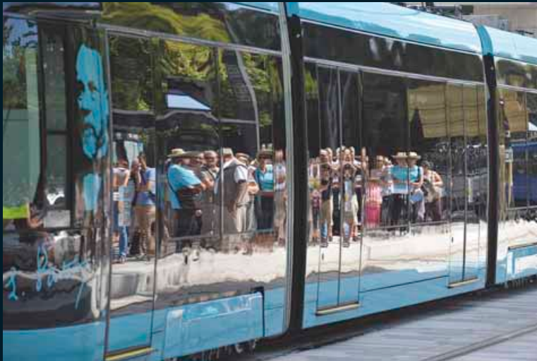
L'engouement à chaque station se reflète dans les rames...