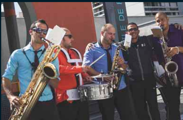
La station Île de France à Planoise a vu une belle communion entre artistes et habitants.