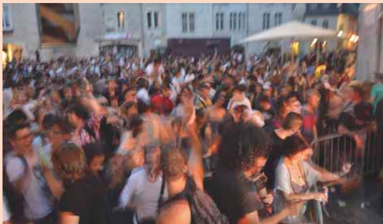
La traditionnelle Fête de la musique le 21 juin a enthousiasmé de nombreux Grand Bisontins.

Les 8, 9 et 10 août, Saône accueillait les championnats du monde de vélo couché . 150 participants issus de 15 pays différents se sont affrontés pour remporter le titre de champion du monde de cette discipline insolite.