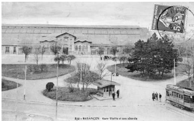
L'ancien tramway de Besançon, ici vers la gare Viotte, a cessé son activité en 1952.

« Transport Collectif en Site Propre » (TCSP) se précise. En cela, le retour du tram s'inscrit dans la continuité de la politique de mobilité ambitieuse, menée par la Ville de Besançon depuis les années 1970, et dont l'Agglomération est l'héritière. Par exemple, le grand public sait bien que la capitale franco-comtoise fut la première ville française à introduire un secteur piétonnier dans son cœur historique, dès 1974. Mais qui se souvient que, dès 1975, un système permet de localiser en permanence les bus en circulation pour permettre au personnel de régulation d'avoir une vision globale du réseau. C'est alors une première mondiale ! Des innovations de la sorte permettent aux transports bisontins de figurer parmi les plus fréquentés de France, depuis près de 40 ans. Mais le réseau est peu à peu victime de son succès, avec des lignes saturées en heures de pointe. S'ajoutent à cela des vitesses commerciales se réduisant sous l'effet du trafic automobile. C'est pourquoi, en 2004, le Grand Besançon lance une étude d'opportunité sur la mise en place d'un transport en commun en site propre. L'année suivante, le principe de réalisation d'une liaison en site propre intégral reliant l'ouest à l'est de l'agglomération, en pas-