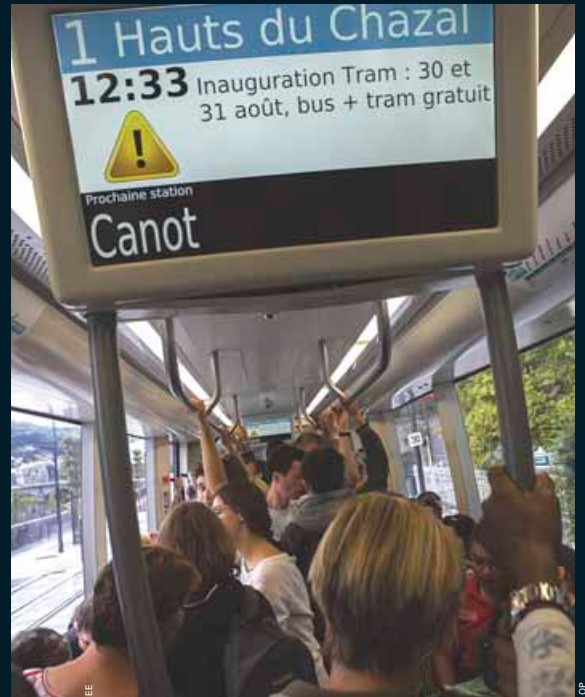
Les rames quelque peu victime de leur succès avec un engouement incroyable durant 2 jours !