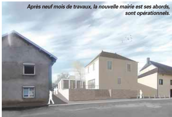
Après neuf mois de travaux, la nouvelle mairie est ses abords, sont opérationnels.