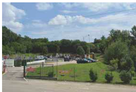
La déchetterie de Pirey sera l'une de celles qui accueillera les usagers lors des travaux de modernisation du site des Tilleroyes cet automne.

Construite dans les années 90, la déchetterie de Besançon-Tilleroyes doit s'adapter à une activité croissante. Première déchetterie du Grand Besançon en terme de fréquentation avec 110 000 visiteurs par an et des pics jusqu'à 800 personnes par jour, le site n'était plus adapté pour répondre à cette intense activité. Début septembre, la déchetterie ferme temporairement ses portes au public pour entamer une véritable cure de jouvence. Durant trois mois, des travaux d'envvergure permettront de moderniser et sécuriser la déchetterie, d'élargir les voies internes de circulation et d'intégrer les nouvelles normes réglementaires. Avec 17 bennes au lieu de 14 actuellement, le site pourra développer de nouvelles filières de traitement et ainsi gagner en efficacité. Pendant la durée des travaux, un accueil physique sera assuré à l'entrée du site pour guider les usagers vers les autres points d'apport volontaire à proximité gérés par le SYBERT. À partir de