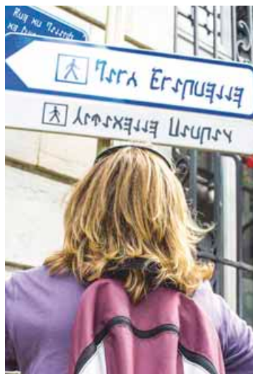
Lutter contre l'illettrisme : formagraph a lancé un jeu pour aider toutes les personnes qui ont des difficultés à lire et à écrire.

➔ Jeu à découvrir sur : imagana.com Plus d'informations sur projet-imagano.fr