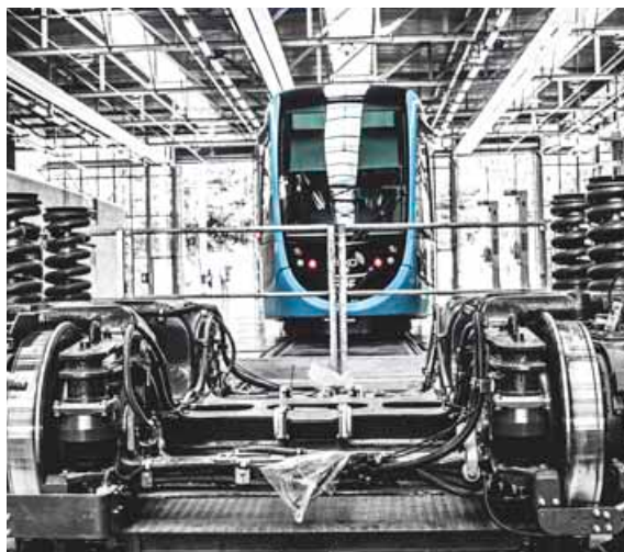
Le nouveau centre de maintenance permettra de "bichonner" les 19 rames du tram grand bisontin.