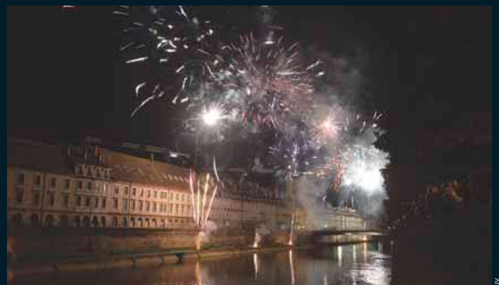
Cerise sur le gâteau de cette enthousiasmante inauguration, l'embrasement du Doubs devant plusieurs milliers de Grand Bisontins.