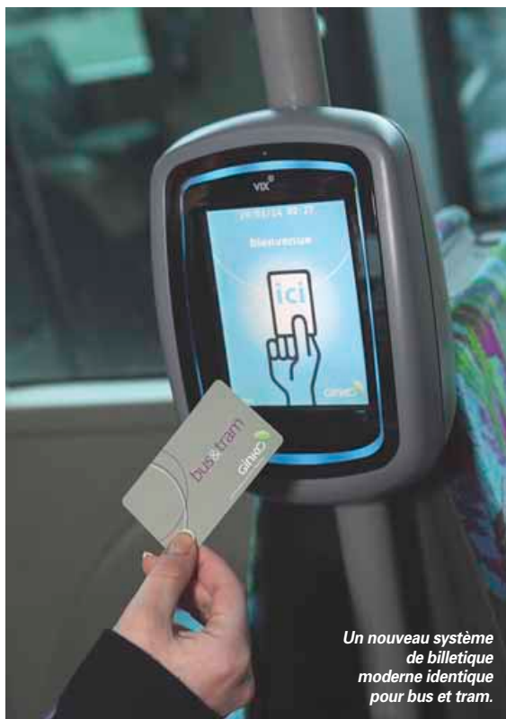
Un nouveau système de billetterie moderne identique pour bus et tram.

Ces lieux stratégiques, situés aux entrées de Besançon, permettent aux habitants de la périphérie de passer du car venant de leur commune aux bus desservant les quartiers de Besançon et le centre-ville en quelques mètres seulement. L'arrivée du tram sur trois de ces pôles (Micropolis, Saint-Jacques et Orchamps) vient encore dyna-