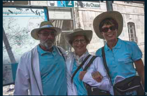
Un week-end d'animations réussi grâce aux centaines de bénévoles mobilisés pour l'occasion.