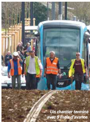
Un chantier terminé avec 9 mois d'avance.

Entre 2006 et 2008, des études approfondissent la question de l'insertion urbaine de cette liaison, en analysant des variantes de tracé et de matériel roulant. Leurs conclusions soulignent l'intérêt du mode tramway. Ce dernier recueille d'ailleurs l'adhésion du public, lors de la concertation préalable organisée entre septembre et décembre 2008. Dans la foulée, un projet de référence est adopté le 30 juin 2010, avec un tram sur fer et un tracé via Battant et Révolution. Entre décembre 2010 et janvier 2011, le tram fait l'objet d'une enquête publique et le projet est reconnu d'utilité publique, en juin 2011. La construction peut enfin être lancée.