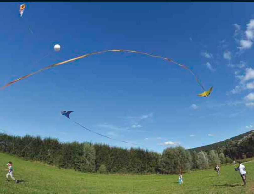
Au terminus Chalezeule ce sont les cerfs-volants qui ont amusé petits et grands.