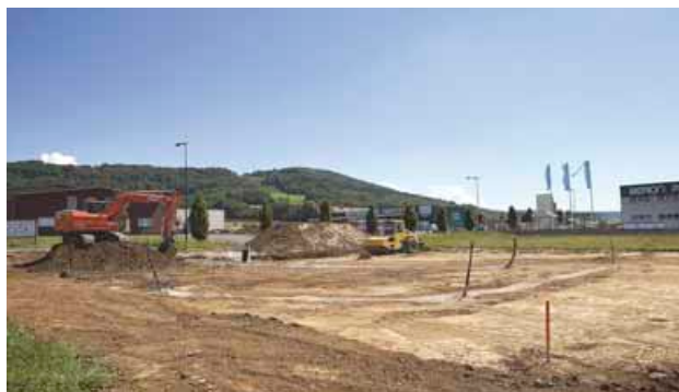
La Zone du Noret poursuit son développement.

➔ Service développement économique du Grand Besançon, www.investinbesancon.fr , 03 81 65 06 90