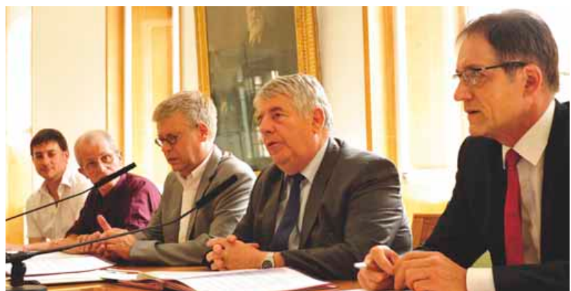
Le 10 juin dernier, les élus du Grand Besançon ont signé la convention de partenariat avec les représentants de l'établissement français du sang.

Le Grand Besançon devient la première agglomération de France à signer une convention de partenariat avec l'Établissement Français du Sang (EFS). L'agglomération et la Ville de Besançon ont en effet formalisé en juin dernier avec l'EFS Bourgogne Franche-Comté et l'association des Donneurs de Sang Bénévoles de Besançon, leur mobilisation pour mener des actions dans le plus grand nombre de communes. L'objectif, à court comme à long terme, est d'inciter les populations à donner leur sang tout en fidélisant les donateurs. Alors que cette convention, fruit d'une initiative nationale lancée en 2010 par l'association des maires de France ne concernait jusqu'alors que les communes, le Grand Besançon est précurseur dans la démarche. Pour Pascal Morel, directeur de l'EFS Bourgogne Franche-Comté, « C'est un nouveau pas en avant, car si 98 % des Français reconnaissent que le don de sang permet de sauver des vies, seulement 4 % passent effectivement à l'acte. »