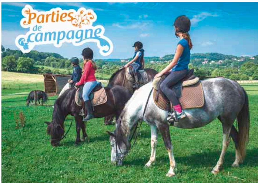
Les chevaux seront notamment à l'honneur lors de cette 5 e édition de «Partie de campagne».

➔ www.grandbesancon.fr ou 03 81 65 02 47