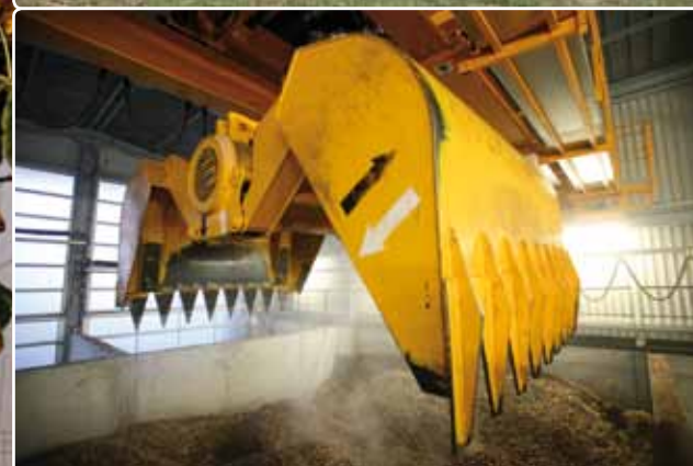
▲ LE BOIS TRANSFORMÉ EN PLAQUETTES, COMBUSTIBLE DE LA CHAUFFERIE DE PLANOISE.