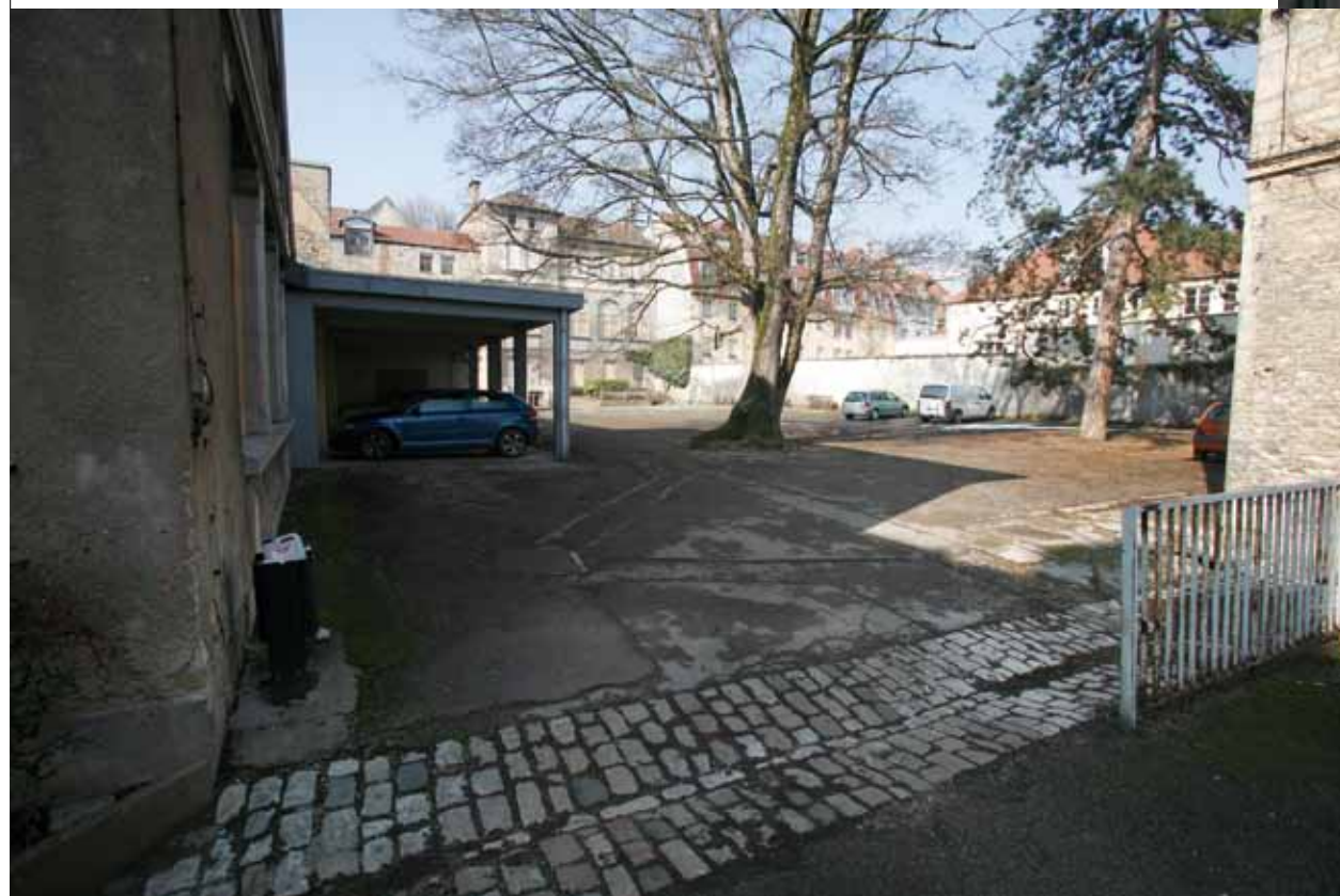
LE 6, RUE DE LA MADELEINE : UNE ENFILADE DE CINQ BÂTIMENTS ET QUATRE COURS DONT LA REQUALIFICATION EST PROGRAMMÉE.