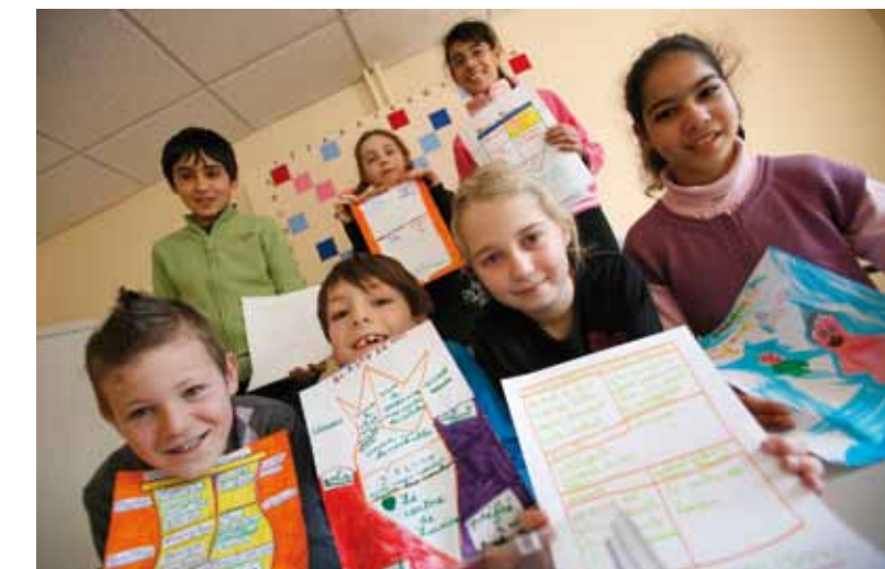
DE FUTURS AUTEURS PRÊTS À "TRAVAILLER" PENDANT LES VACANCES.

Centre de loisirs du Barbox - 15, rue Jean Wyrsh. Tél. 03 81 80 61 81. Site : http://clbarbox.free.fr