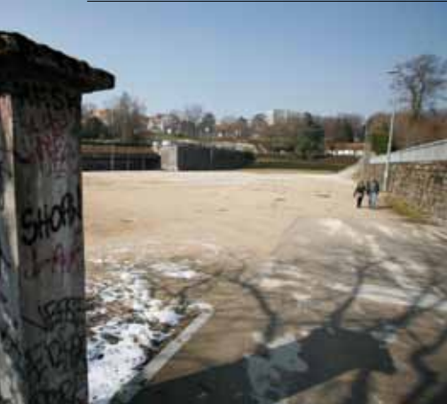
▲ LE STADE D'ARÈNES ACCUEILLERA 220 PLACES.

La loi Handicap 2005 imposant des cheminements d'au moins 1,40 m de large et libres de tout obstacle pour assurer la continuité du déplacement, la Ville a adopté en décembre 2009 un plan de mise en accessibilité de 130 km de voies, à hauteur de 9 M€ et étalé sur 15 ans. Bien évidemment, Battant aura sa part de travaux et les premières interventions seront effectuées courant 2011. À l'image de ce qu'elle