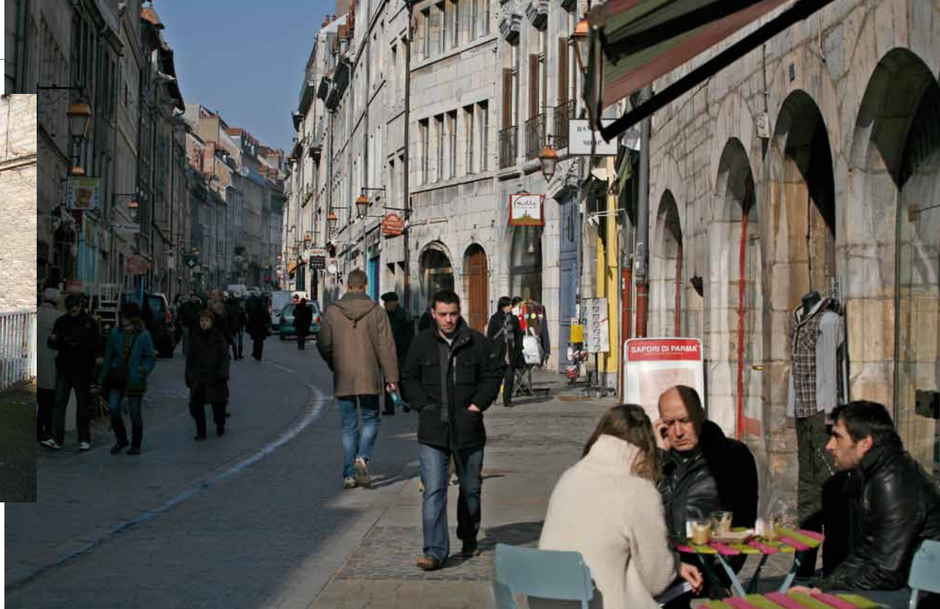
LA PARTIE BASSE DE LA RUE BATTANT : UN ESPACE PIÉTONNIER ET ANIMÉ À PRÉSERVER.