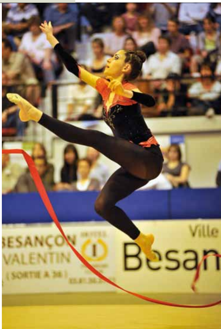
AVEC LA CORDE, LE BALLON, LES MASSUES ET LE CERCEAU, LE RUBAN FAIT PARTIE DES CINQ ENGINES UTILISÉS PAR LES GYMNASTES.

Contact : Besançon Gymnastique Rythmique au 03 81 82 05 96.