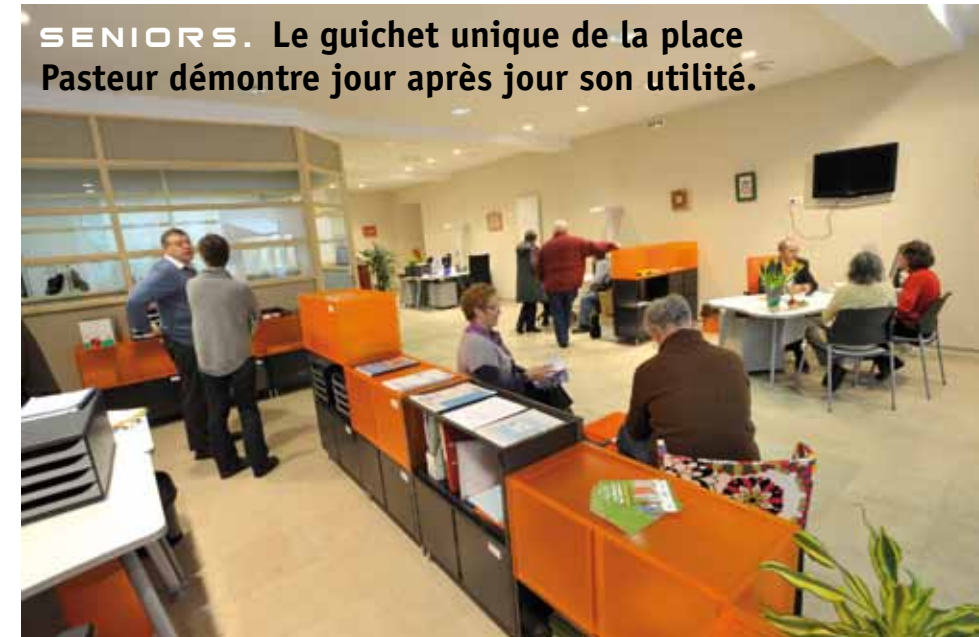
UN LIEU D'INFORMATION ET DE RENCONTRES.

SENIORS. Le guichet unique de la place Pasteur démontre jour après jour son utilité.