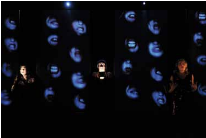
REMONTERONT-ILS À LA SURFACE AVANT LE DÉBUT DU VRAI SPECTACLE ? ▲

Imaginez un texte théâtral qui célèbre le théâtre lui-même. Avec Le cabinet de curiosités , le metteur en scène Christian Duchange a réuni toute une équipe. Des comédiens, des techniciens, une costumière, un vidéaste et un musicien prêts à se jeter à l'eau dans les profondeurs du théâtre. Cette histoire commence dans les loges, la peur au ventre, les acteurs s'interrogent. Le public se trouve alors immergé au cœur d'un dispositif étrange et surréaliste qui dévoile un univers peuplé de sirènes et de princesses. La compagnie l'Artifice, à l'origine de ce spectacle, est en résidence pour trois saisons au Théâtre de l'Espace. Après Nam Bock le Hableur en 2009, ce Cabinet de curiosités est une clause majeure du bail établi entre les deux partenaires. Au même moment, dans un décor à tiroirs et pas mal d'effets très spéciaux, comédiens et spectateurs explorent ensemble les abysses de l'imagination.