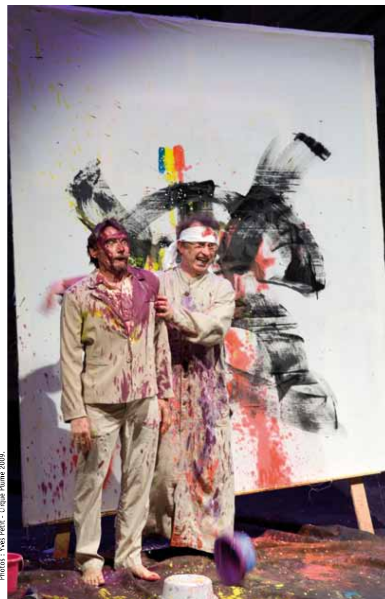
Cirque Plume 2009.

L'Atelier du peintre - Du 30 mars au 18 avril site d'Arènes www.cirqueplume.com