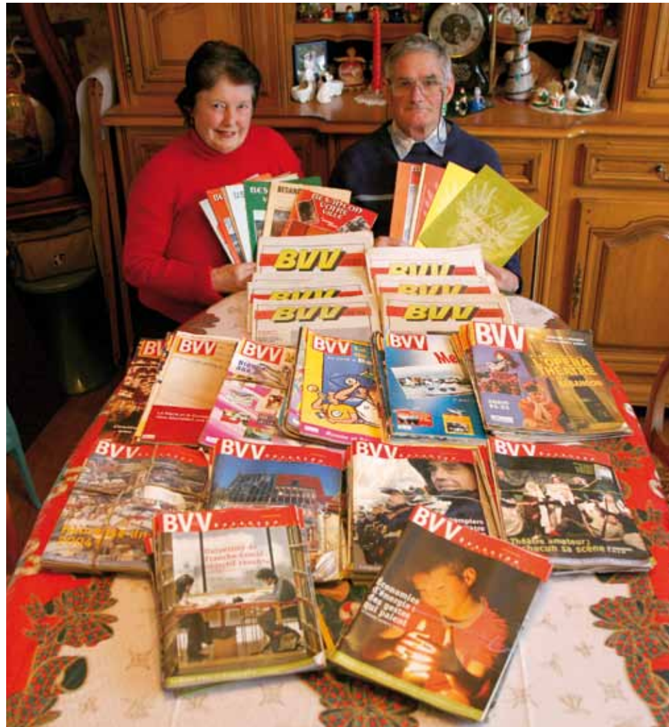
UNE COLLECTION PATIEMMENT CONSTITUÉE ET SOIGNEUSEMENT ARCHIVÉE.