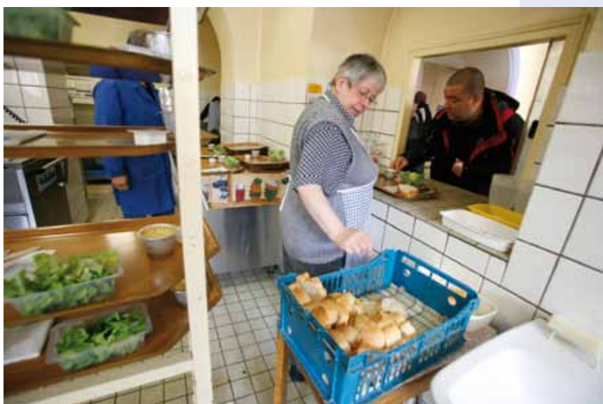
◀ PRÉPARÉS PAR LA CUISINE DU LOGEMENT-FOYER MARULAZ, LES REPAS SONT ENSUITE LIVRÉS RUE CHAMPROND.