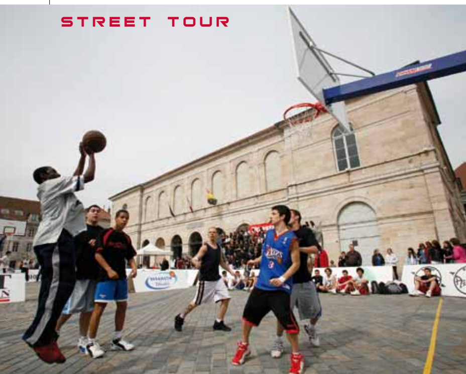
L'HEURE DE LA FINALE SONNERA JEUDI 15 AVRIL.