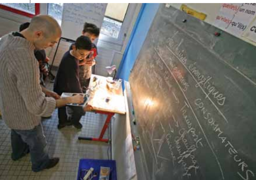
▲ DANS UN COLLÈGE, OPÉRATION DE SENSIBILISATION À LA MAÎTRISE DE L'ÉNERGIE.