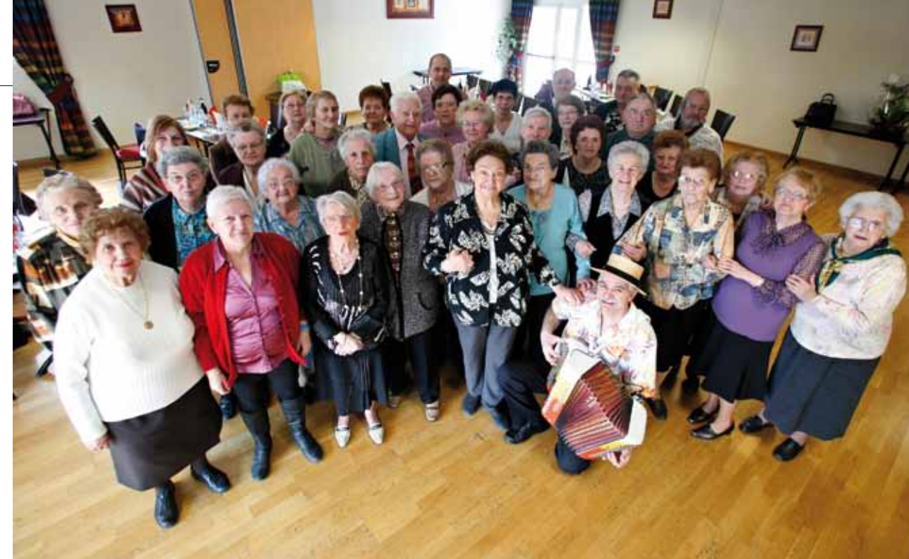
« L'ASSOCIATION FONCTIONNE COMME UNE GROSSE FAMILLE », ASSURE SA PRÉSIDENTE.