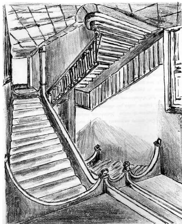
DES MILLIERS DE FUTURS MAÎTRES D'ÉCOLE ONT EMPRUNTÉ CES ESCALIERS (DESSIN DE JEAN GRÉVY).

libres, les élèves vont quelquefois au théâtre, souvent au café... Ils ont la malheureuse habitude de passer la plus grande partie des sorties dans les cafés ». Des parents s'inquiètent parce que l'établissement « avoisine le quartier de la prostitution » et est à proximité du « violon » (poste de police), « ce qui permet à nos élèves maîtres d'entendre des scènes de violence, les jurons et les expressions obscènes des vagabonds et des filles ».