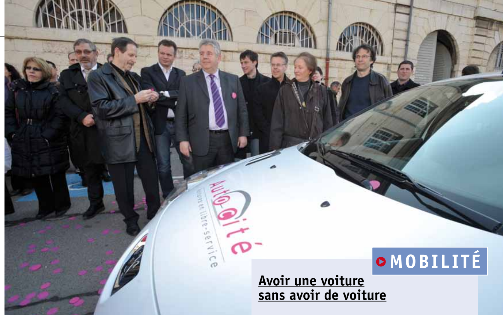
APRÈS LE SUCCÈS DE VÉLOCITÉ, L'AUTOPARTAGE ARRIVE À BESANÇON. SIMPLE, ÉCONOMIQUE ET ÉCOLOGIQUE.