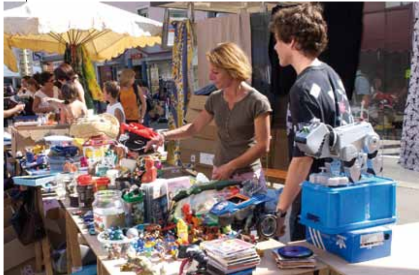
UN TEMPS FORT DE LA VIE DU QUARTIER.

Manifestation printanière toujours très prisée, le traditionnel vide-grenier du quartier a lieu cette année le dimanche 25 avril, à partir de 9 h pour les visiteurs. Rançon du succès, Tambour Battant, qui orchestre la 12 e édition de cet événement populaire à souhait, propose aux stands de s'étaler au-delà de la place Marulaz. Après la cour de l'ancienne maternelle, c'est en effet au tour de la première cour du lycée Condé d'ouvrir ses portes aux exposants. L'Espace des Bains Douches s'installera de son côté rue de l'École avec les asso-