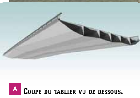
▲ COUPE DU TABLIER VU DE DESSOUS.