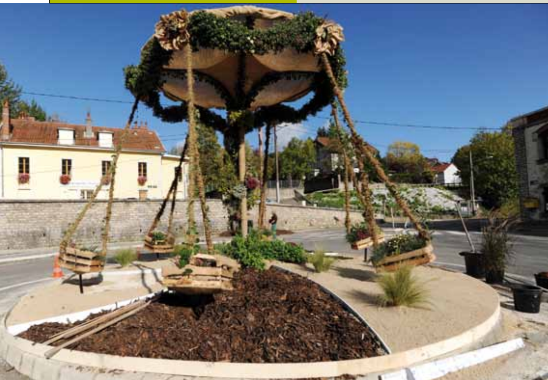
LES JARDINIERS MUNICIPAUX N'ONT PAS MÉNAGÉ LEURS EFFORTS PLACE GUYON (CI-DESSUS) ET SQUARE SARRAIL.