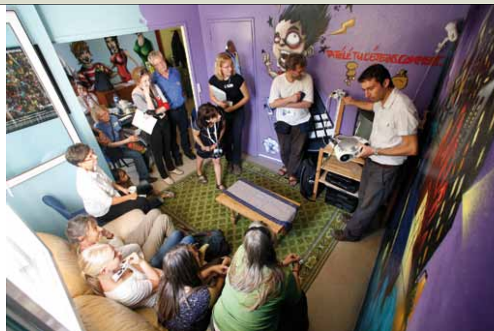
MÊME EN VEILLEUSE, LES APPAREILS MÉNAGERS CONSOMMENT DE L'ÉNERGIE.