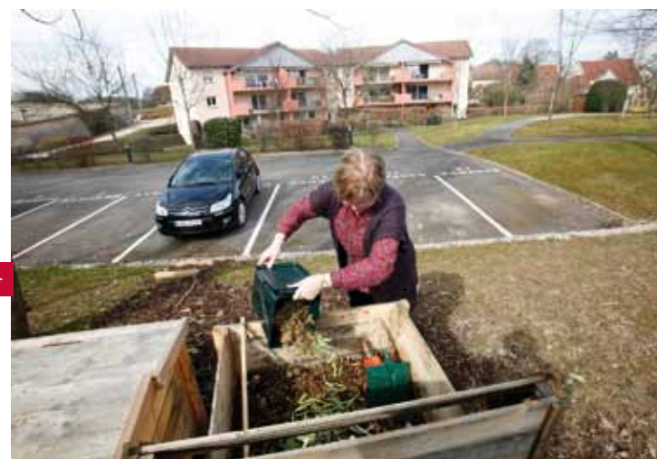
UN BON EXEMPLE À SUIVRE.

http://www.sybert.fr . Inscription obligatoire auprès du SYBERT (tél : 03 81 21 15 60).