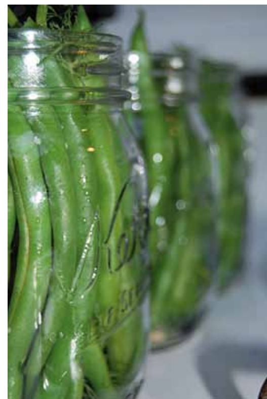
LA NUTRITION, THÈME ABORDÉ PAR LE SPECTACLE "LE DÉBUT DES HARICOTS".

l'accompagne dans la mise en œuvre de ce programme qui propose 5 rendez-vous aux habitants, aux scolaires et aux familles, à commencer par celui de "Paroles en tête", l'exposition coordonnée par la Maison de l'adolescent, qui vise à la prévention des conduites à risques chez les jeunes de 13 à 18 ans. Accueillie du 24 octobre au 17 novembre à la MJC, elle se tiendra ensuite jusqu'au 30 novembre au collège Proudhon. En complément, le 22 à la MJC, une soirée débat autour du thème "Le mal-être à l'adolescence" permettra aux parents dès 18 h 30 d'échanger avec des professionnels sur cette phase délicate de la vie.