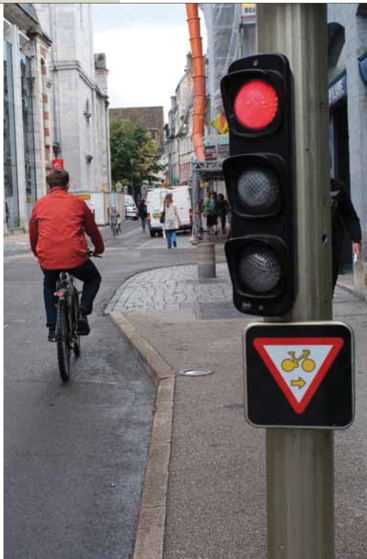
↑ UN DROIT SYNONYME DE PRUDENCE ET DE RESPECT DES AUTRES USAGERS.

Depuis quelques semaines à Besançon, les cyclistes ont le droit de franchir certains feux rouges à condition, bien sûr, de céder le passage aux véhicules de la voie rencontrée et aux piétons. Validée par décret du 12 novembre 2010 et dûment autorisée par le maire dans le cadre de son pouvoir de police, cette nouveauté du code de la Route vise à rendre plus fluide les déplacements des cyclistes dont, en retour, on attend un respect accru des règles communes de circulation. Deux panneaux ont ainsi fait leur apparition, l'un signifiant la possibilité de tourner à droite et uniquement sur la première voie de droite, et l'autre d'aller tout droit lorsqu'il n'y a pas de voie de droite. À l'issue d'une première phase, 32 carrefours à feu sur une quarantaine possible ont été équipés, les autres n'étant pas concernés parce qu'ils présentent des risques pour les usagers en raison d'un manque de visibilité, parce qu'il s'agit de rues fortement circulées ou parce qu'ils se trouvent le long du tracé du Tram et nécessitent une évaluation plus poussée des dangers éventuels. Attention ! Dans le cadre du nouveau dispositif baptisé « Cédez le passage », il est important de rappeler que les cyclistes ne sont jamais prioritaires et que l'obligation d'arrêt aux feux orange et rouge les concernent toujours à chaque intersection, au même titre que les autres usagers.