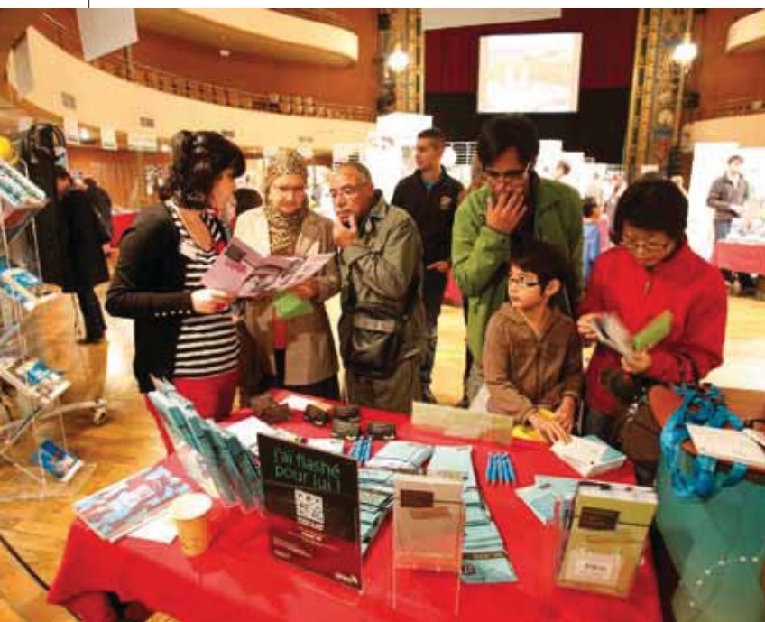
↑ UNE MATINÉE POUR TOUT DÉCOUVRIR OU PRESQUE...