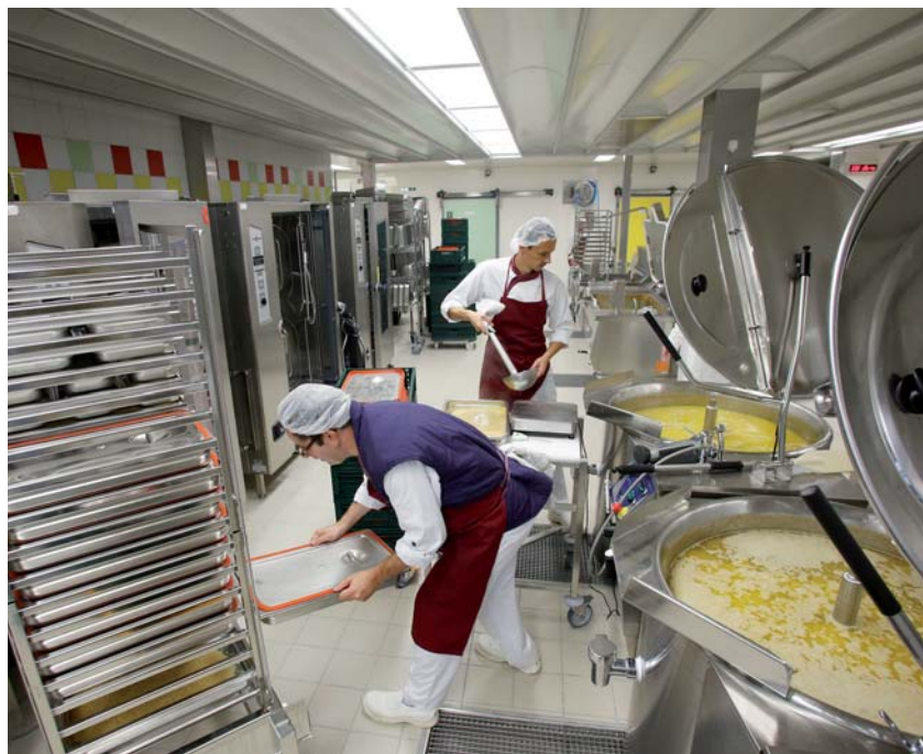
↑ 9 H 30 : APRÈS LA CUISSON, LES ALIMENTS SONT CONDITIONNÉS DANS LES PLATS DE SERVICE.