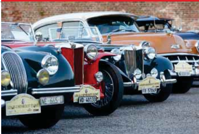
← CHROMES RUTILANTS ET CYLINDRÉES IMPRESSIONNANTES.