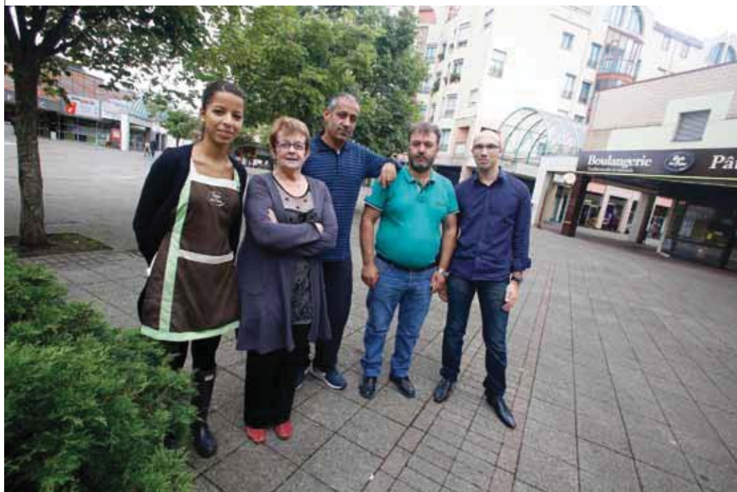
← LES MEMBRES DE L'ASSOCIATION « ESPACE COMMERCIAL CASSIN PARC EUROPE » NE MANQUENT PAS D'IDÉES ET D'ENTHOUSIASME.

taine de commerçants et artisans locaux». Restaurants, métiers de bouche et autres enseignes se répartiront place Cassin, place de l'Europe et avenue du Parc. Comme l'événement se veut multi générationnel et familial, des animations ont été programmées pour les enfants autour de structures gonflables installées place Cassin les mercredi 9 et samedi 12, de