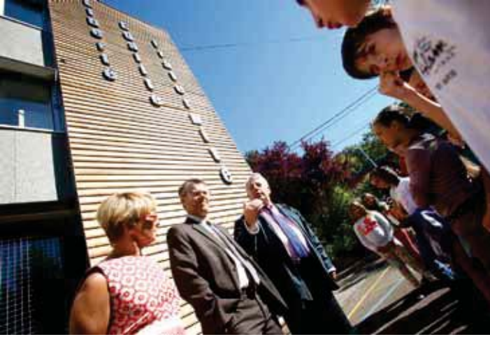
← LA DEVISE RÉPUBLICAINE AU CŒUR D'UN ÉCHANGE SYMPA.

Ancienne 2 e plus importante école de France (52 classes !) dans les années 70, Brossolette, avec 10 classes et 2 CLIS aujourd'hui, est un établissement à taille humaine qui a fait