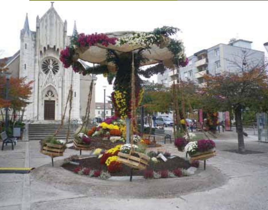
← L'AN DERNIER, LE MANÈGE (CI-CONTRE) ET LE BATEAU AVAIENT DONNÉ DES COULEURS À SAINT-CLAUDE ET À PLANOISE.

environ, juste avant les premières gelées, le blanc, le cuivre, le jaune, le rose et le rouge orneront les compositions suivant des thématiques différentes selon les quartiers : «ça, c'est le bouquet» place Marulaz ; «la tête en friche» place Pasteur ; «les sculptures» place Guyon ; «le naufragé» à l'angle de la rue Résal et de la rue de Belfort ; «océan d'automne» à la maison de quartier Grette/Butte ;