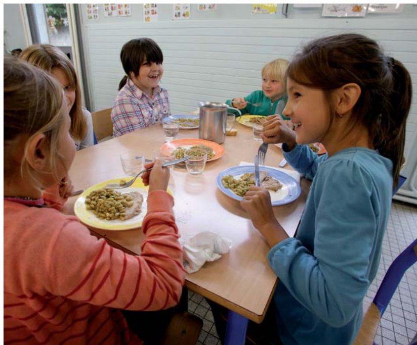
↑ MIDI : BON APPÉTIT !

objectifs de restauration scolaire. La Cuisine, qui dépend de la Direction Éducation, participe à l'éducation et à l'épanouissement des enfants en contribuant à développer une formation au goût et à la découverte de l'art culinaire. Ainsi, les cuisiniers respectent les règles d'hygiène pour garantir la sécurité alimentaire des enfants, et produisent des repas en ayant le souci de la qualité nutritionnelle, culinaire et de la diversité des aliments, des recettes, des menus. Tout en privilégiant les circuits courts, le maximum de produits bio (comme par exemple le pain semi-complet à base de farines de Franche-Comté) issu de l'artisanat local.