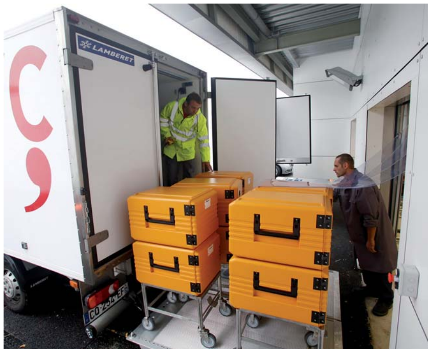
↑ 10 H 30 : CHARGEMENT DES CONTAINERS DANS LES HUIT CAMIONS AVANT LE DÉPART. LE TEMPS EST COMPTÉ, 80 SITES ATTENDENT LA LIVRAISON.