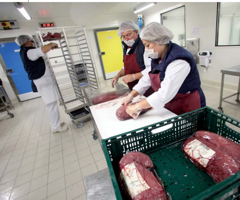
↑ 8 H : LES PRODUITS SONT SORTIS DE LEUR EMBALLAGE, AFIN D'ÊTRE CUITS OU DE PASSER EN CHAMBRE FROIDE. C'EST LA « FRAGILISATION ».