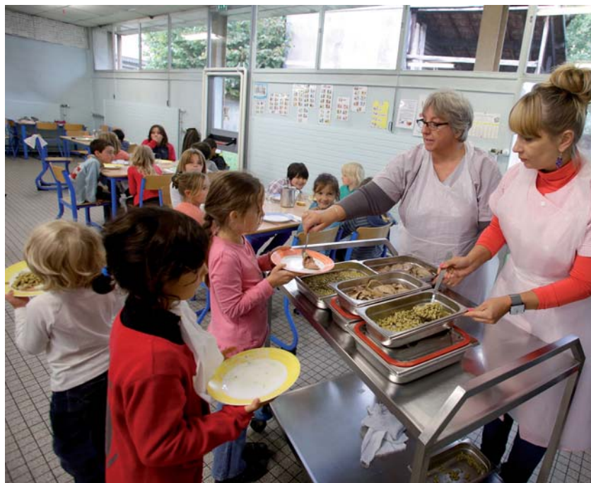
↑ 11 H 50 : LES ALIMENTS PASSENT DE LA MARMITE À L'ASSIETTE !