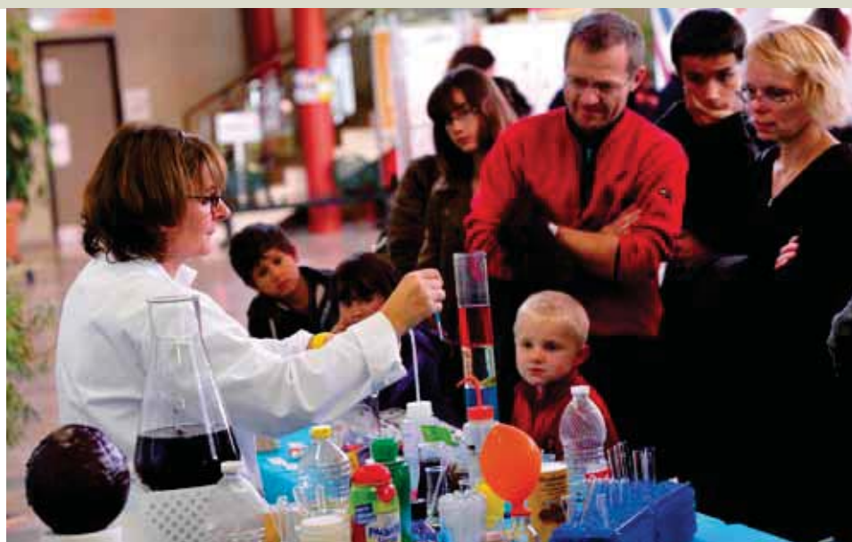
↑ L'OCCASION DE FAIRE LE PLEIN D'EXPÉRIENCES POUR GRANDS ET PETITS.