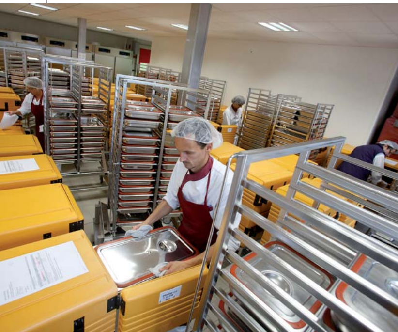
↑ 10 H : LES PLATS DE SERVICE SONT ENTREPOSÉS DANS DES CONTAINERS SPÉCIAUX, QUI GARDENT LES ALIMENTS AU CHAUD.