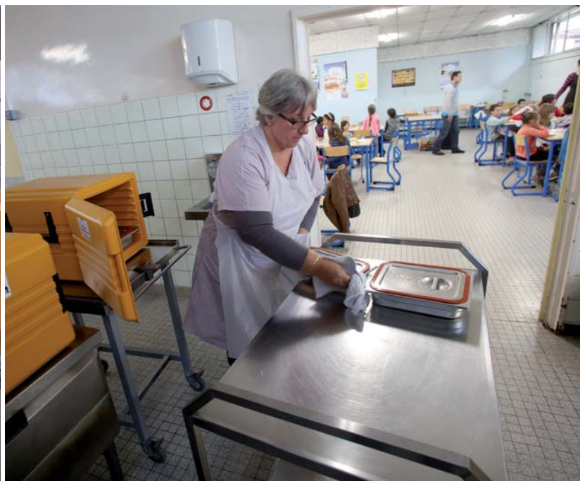
↑ 11 H 45 : LES AGENTS DE SERVICE ASSURENT LES DERNIERS PRÉPARATIFS. VITE, LES ENFANTS ATTENDENT DÉJÀ !