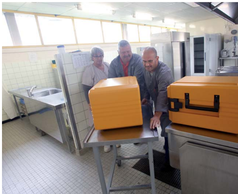
↑ 11 H 15 : ARRIVÉE DES CONTAINERS DANS LES RESTAURANTS SCOLAIRES, ICI DANS CELUI DES VIEILLES-PERRIÈRES.