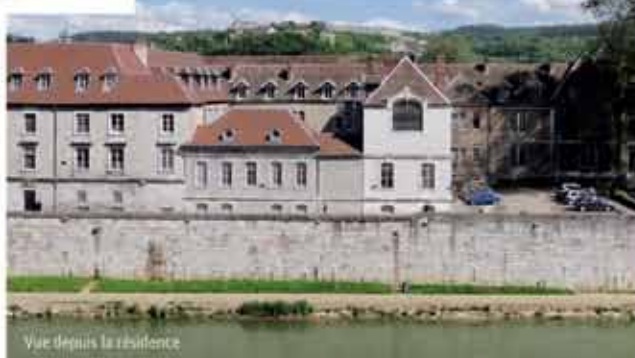
Vue depuis la résidence