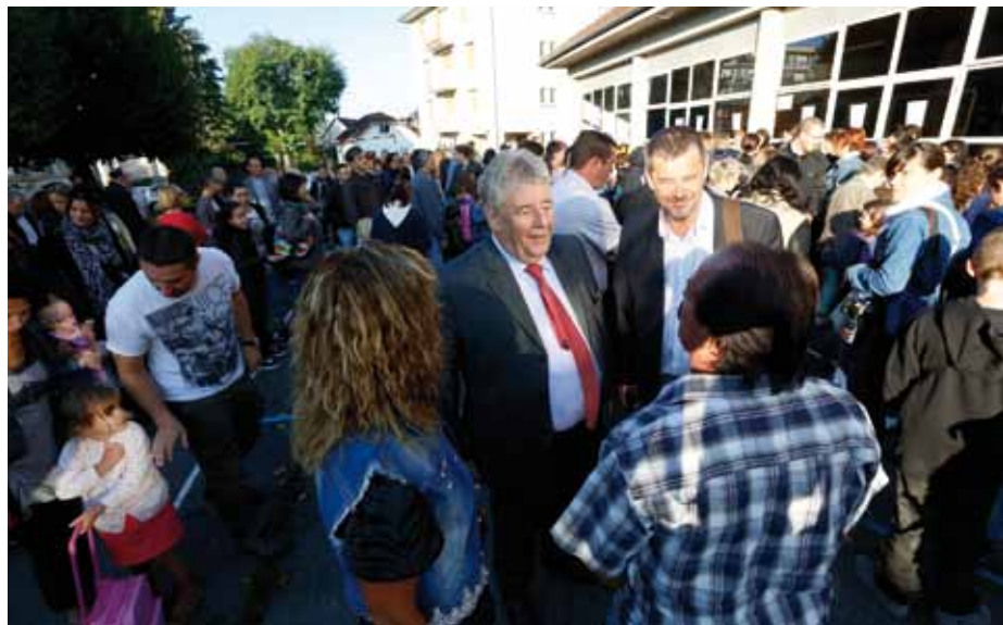
↑ L'ÉCOLE PIERRE ET MARIE CURIE A ÉTÉ LA PREMIÈRE À ACCUEILLIR LE MAIRE ET SA PETITE DÉLÉGATION.