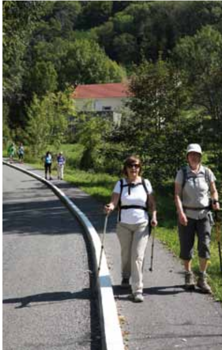
↑ CHACUN SON RYTHME ENTRE DEUX PASSAGES À TABLE.

Les 900 participants (maximum autorisé) à la 9 e Rando gourmande ont eu tout loisir de vérifier le bien-fondé de cet adage improvisé pour l'occasion. Panoramas magnifiques, météo complice, mets et boissons de qualité, ambiance conviviale : tous les ingrédients d'une sortie sportivo-gastronomique réussie étaient rassemblés avant même les premiers départs de la Rodia pour une boucle de 16 km via la Malate, le château médiéval de Montfaucon, Montfaucon, Croix-de-Morre, Morre, la Chapelle-des-Buis et la Citadelle. En lieu et place des sempiternelles barres vitaminées et autres boissons énergétiques, un p'tit dej' costaud, un vin de pêche d'encouragement, un pressé de queue de boeuf au foie gras, une souris d'agneau au thym, fromages, dessert et vins (Sylvaner grand cru, Fitou, fruitière de Pupillin), ont comblé les papilles et apporté toute l'énergie nécessaire à ces marcheurs d'un dimanche si particulier.