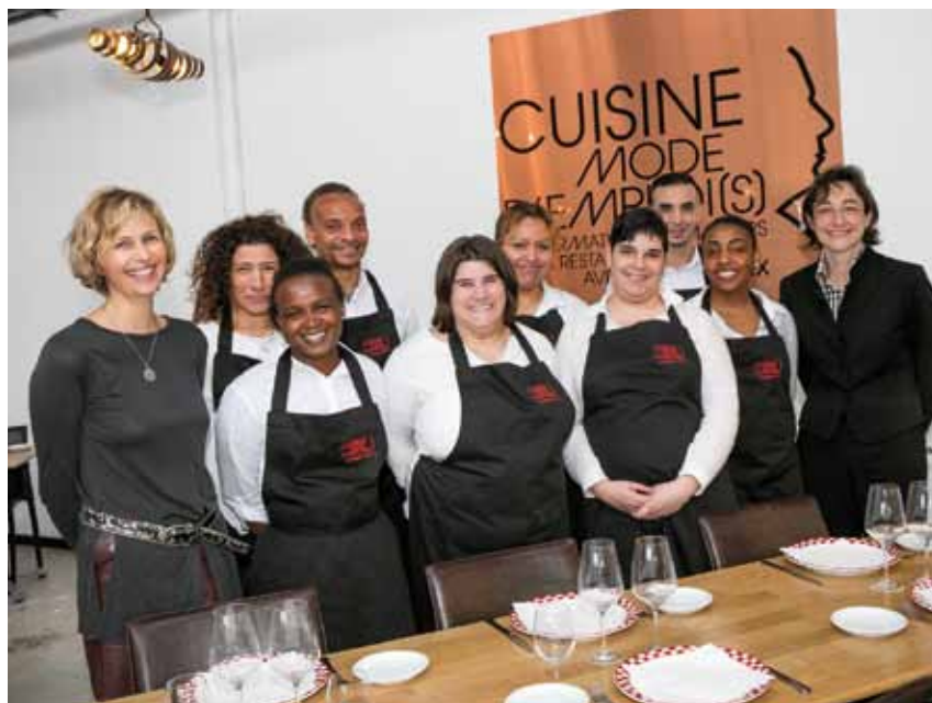
▲ UNE PROMOTION MOTIVÉE ET... SOURIANTE.