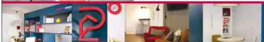
Quelques vues d'une agence Stéphane Plaza Immobilier

Stéphane Plaza Immobilier Agence Besançon 76 rue de Vesoul - 25000 Besançon