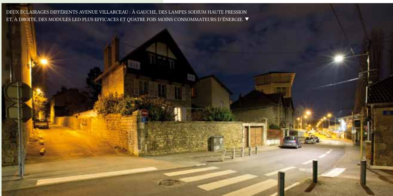
DEUX ÉCLAIRAGES DIFFÉRENTS AVENUE VILLARCEAU : À GAUCHE, DES LAMPES SODIUM HAUTE PRESSION ET, À DROITE, DES MODULES LED PLUS EFFICACES ET QUATRE FOIS MOINS CONSOMMATEURS D'ÉNERGIE. ▼

« Les normes de sécurité ont évolué depuis ces 20 dernières années, affirme Marie Zehaf (photo ci-dessus). Elles sont désormais les mêmes pour tous les tunnels urbains de plus de 300 mètres. » À signaler enfin, la réfection des joints de la chaussée du pont Robert Schwint. Une semaine de travaux est à prévoir à partir du 17 juin, avec maintien du double sens de circulation, avec deux fois une voie.