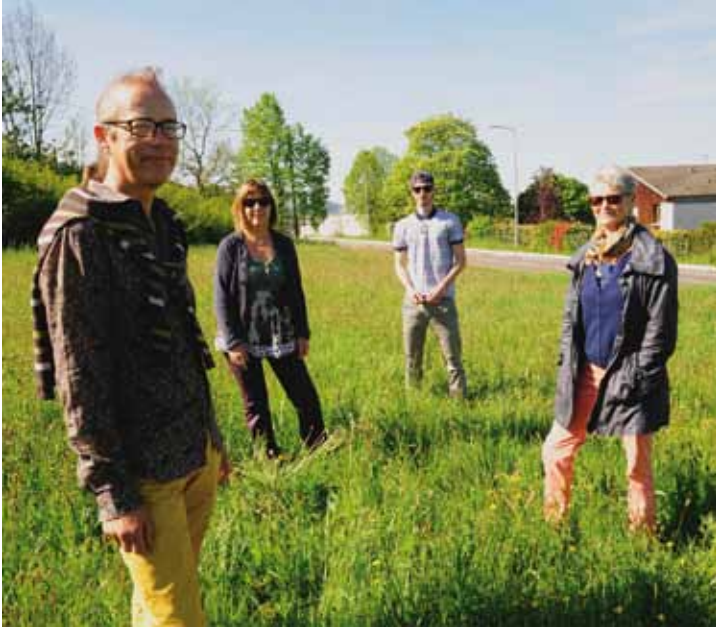
▲ DEUX DES TROIS MÉNAGES INTÉRESSÉS EN VISITE SUR LE SITE DES MONTARMOTS.

► La Ville a lancé en juin 2015 un appel à projets visant à faciliter l'émergence de démarches collectives et citoyennes de construction d'un habitat durable et innovant. Une troisième voie d'accès au logement basée sur l'implication en amont des futurs occupants, propriétaires ou locataires, dans la conception de leur lieu de vie. Mutualisation des moyens, définition partagée du programme et recherche d'un équilibre entre les espaces privatifs et les espaces collectifs, tels sont les fondamentaux de l'habitat groupé.