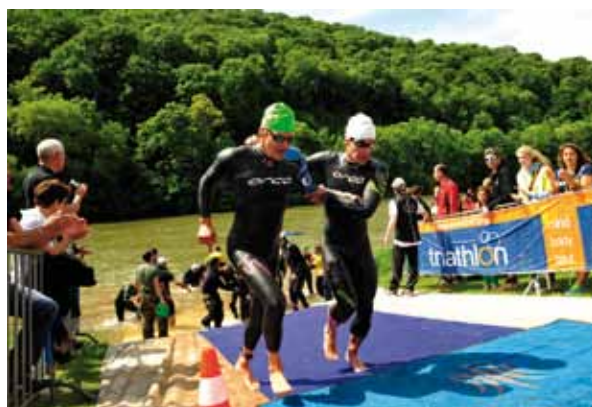
◀ APRÈS L'EAU, LE VÉLO ET LA COURSE À PIED.