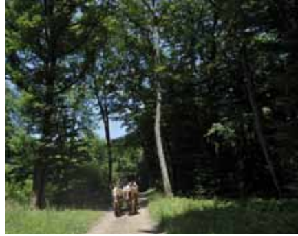
Balade en calèche