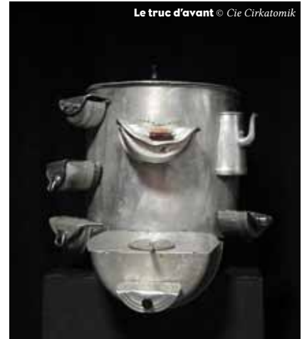
Le truc d'avant

Cette exposition s'intéresse aux objets disparus de notre quotidien dans la deuxième moitié du XX e siècle, reflets d'un mode de vie et témoins d'un contexte passés. Elle invite à s'interroger sur l'évolution de notre société et soulève