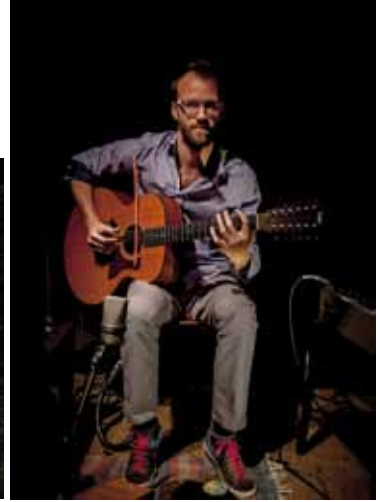
Thibault Florent © Rémi Angeli