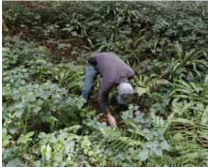
Les couleurs forestières