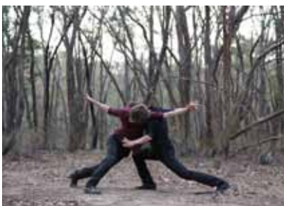
Entomo © Elías Aguirre