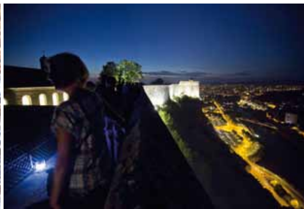
Vauban dans la nuit