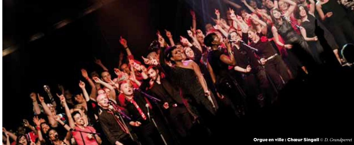
Orgue en ville : Chœur Singall