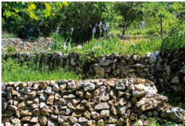
Patrimoine en pierre sèche