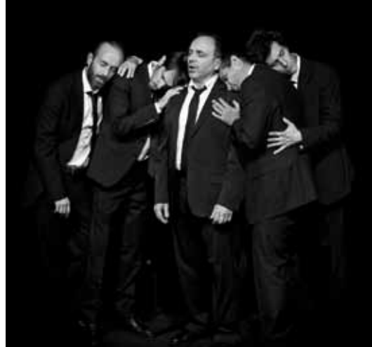
Têtes de chien © Guillaume Sabouraud