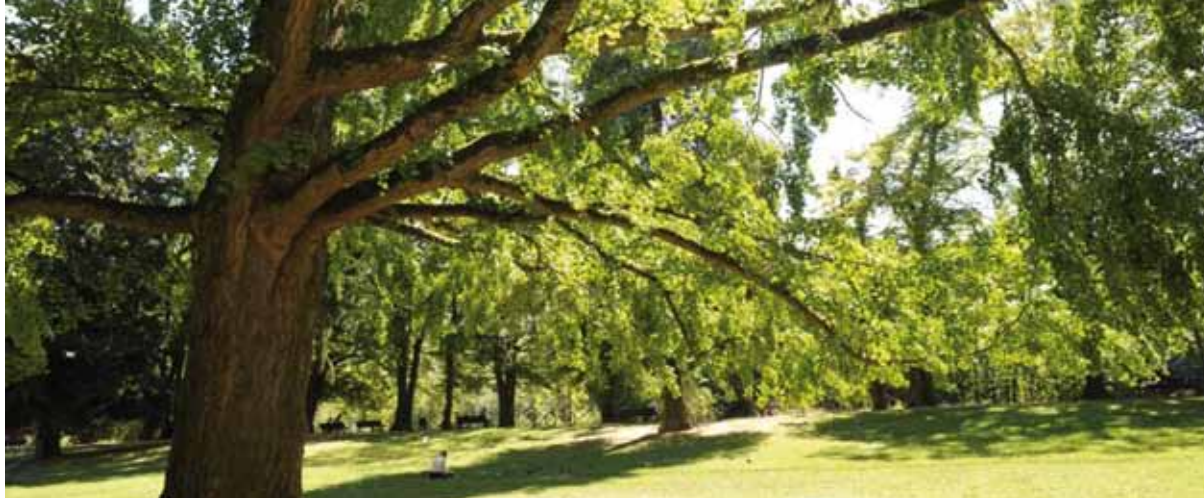
Trésors de nos parcs