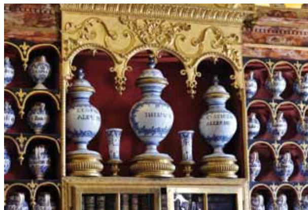
Circuit des apothicaireries