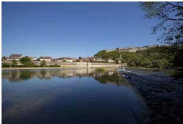
Les fortifications au fil de l'eau