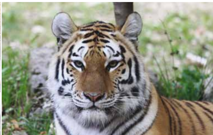
Protection des espèces menacées