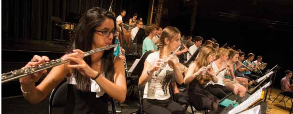
Orchestre des jeunes