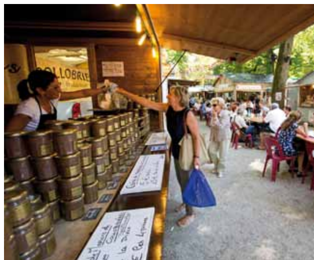
▲ ACHAT D'UN CÔTÉ ET CONSOMMATION SUR PLACE DE L'AUTRE : LA RECETTE D'INSTANTS RÉUSSIS.

Autres nouveautés synonymes de moments conviviaux : la première sortie officielle de la Gangloff, la bière blonde, bio, brassée avec la Bisontine qui effectue son grand retour après un long silence d'un demi-siècle ; la vente