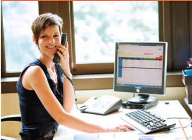
▲ LES PERSONNELS DU CCAS SONT MOBILISÉS.

Être Bisontin, ou agent de la Ville, du CCAS ou de la CAGB. Les Bisontins qui n'ont pas de mutuelle. Ceux qui veulent vérifier si leur contrat est adapté à leurs besoins. Ceux qui souhaitent trouver une solution alliant un bon rapport qualité/prix. Les Bisontins qui n'ont pas de soutien à la mutualisation par leur employeur ou qui pourraient avoir droit à l'ACS (Aide à la complémentaire Santé dispositif CPAM) sans le savoir.