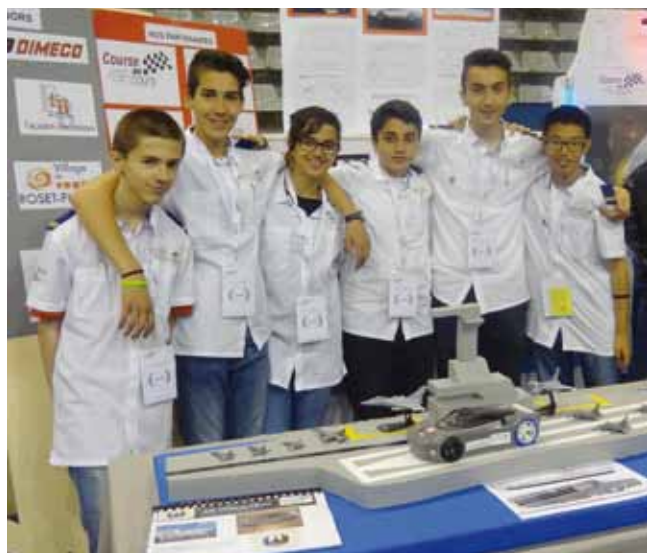
▲ COURSE EN COURS ET CONCOURS : ÇA RIME POUR DIDEROT !

► La classe de 3 e B du collège Diderot à Planoise a participé à la saison 9 du concours « Je filme le métier qui me plaît » en présentant pas moins de 6 films : La règle du jeu ; L'âge du fer ; Les façadiers ; Chauffagiste, masculin, féminin ? ; L'horloger de Battant ; Réveiller les pianos qui dorment . De l'écriture du scénario à l'enregistrement sur DVD, les élèves ont eux-mêmes entièrement réalisé ces reportages de 3 minutes consacrés à des professions de leurs choix. Au palmarès, les trois derniers titres ont reçu au grand Rex à Paris fin mai, le clap d'or, le clap d'argent et le clap de bronze. Une grande fierté pour ces jeunes et les enseignants qui les ont accompagnés dans