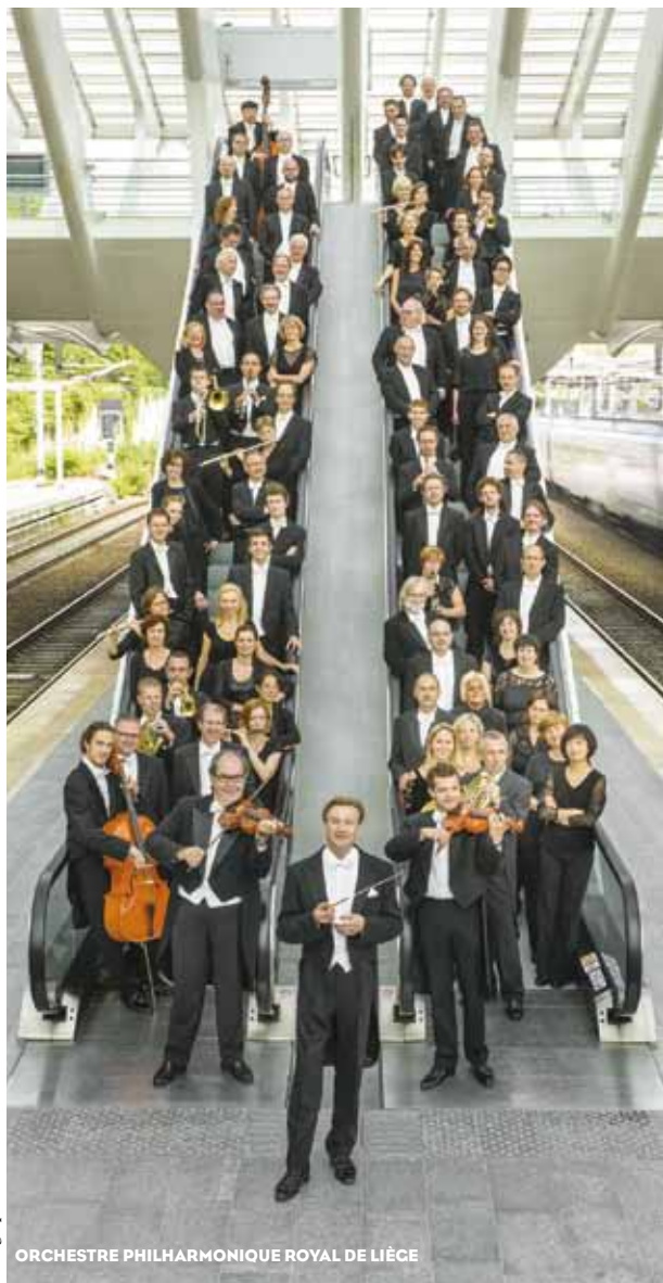
ORCHESTRE PHILHARMONIQUE ROYAL DE LIÈGE