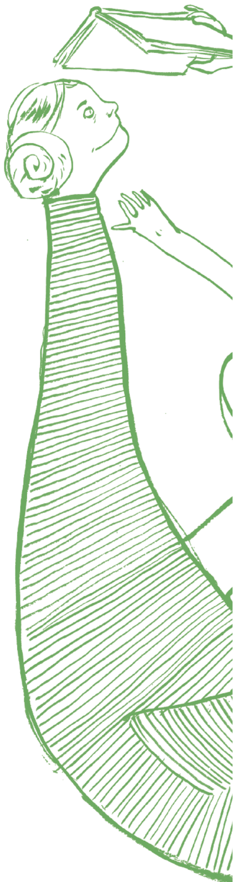
Illustration : Alexandre Lagneau