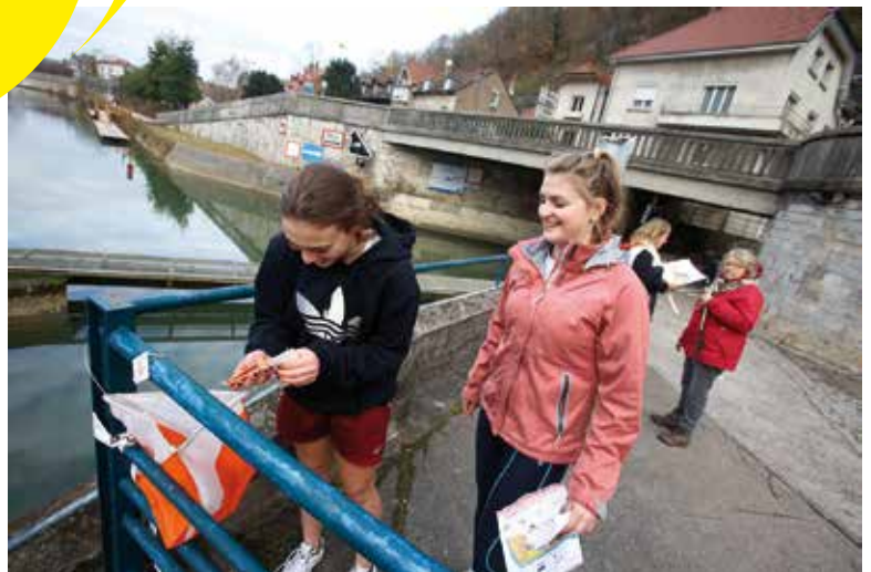
▲ CARTES, BOUSSOLES, BALISES ET... SOURIRES DE RIGUEUR.

► On ne change pas une organisation qui tourne rond ! Les responsables et membres de Balise 25 l'ont fort bien compris, eux qui proposent dimanche 15 octobre à la fois la 9 e édition du Trail Orientation Vauban, la 11 e édition de la Randonnée Orientation Vauban et la 7 e édition de l'Handi-Randonnée Orientation Vauban. De quoi satisfaire toutes les envies et toutes les curiosités en s'élançant à l'assaut de parcours abordables par tous. Nul besoin en effet d'être un champion pour se faire plaisir seul, en groupe ou en famille. Accueil des participants dès