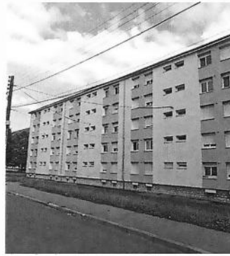
Vue depuis la rue Chopin au NORD du bâtiment