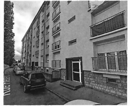
Vue depuis la rue Chopin au SUD du bâtiment (côté boulevard Blum)