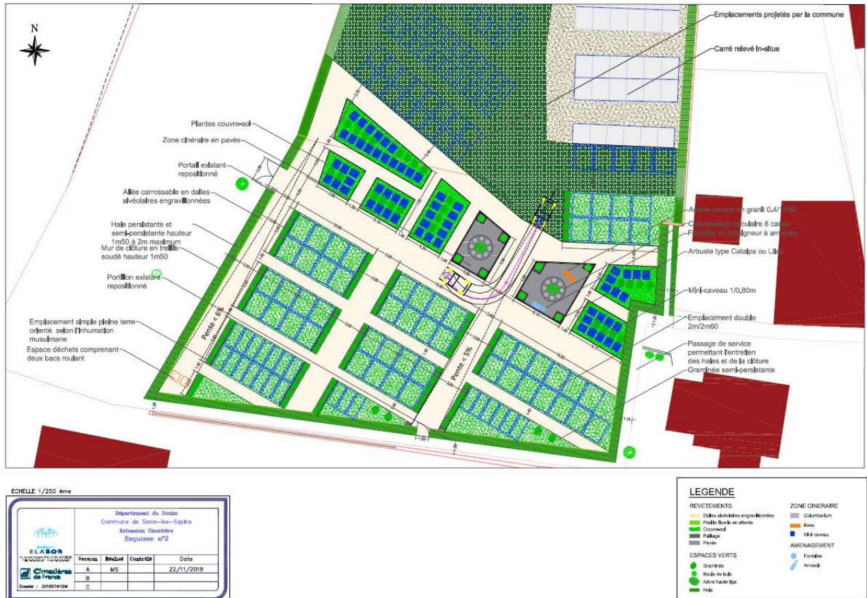
Schéma de l'extension du cimetière