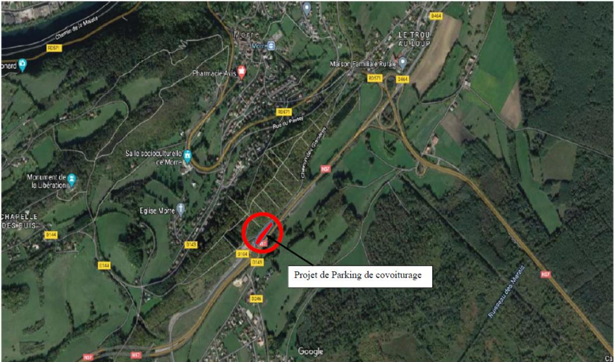
PLAN DE SITUATION – PARKING COVOITURAGE