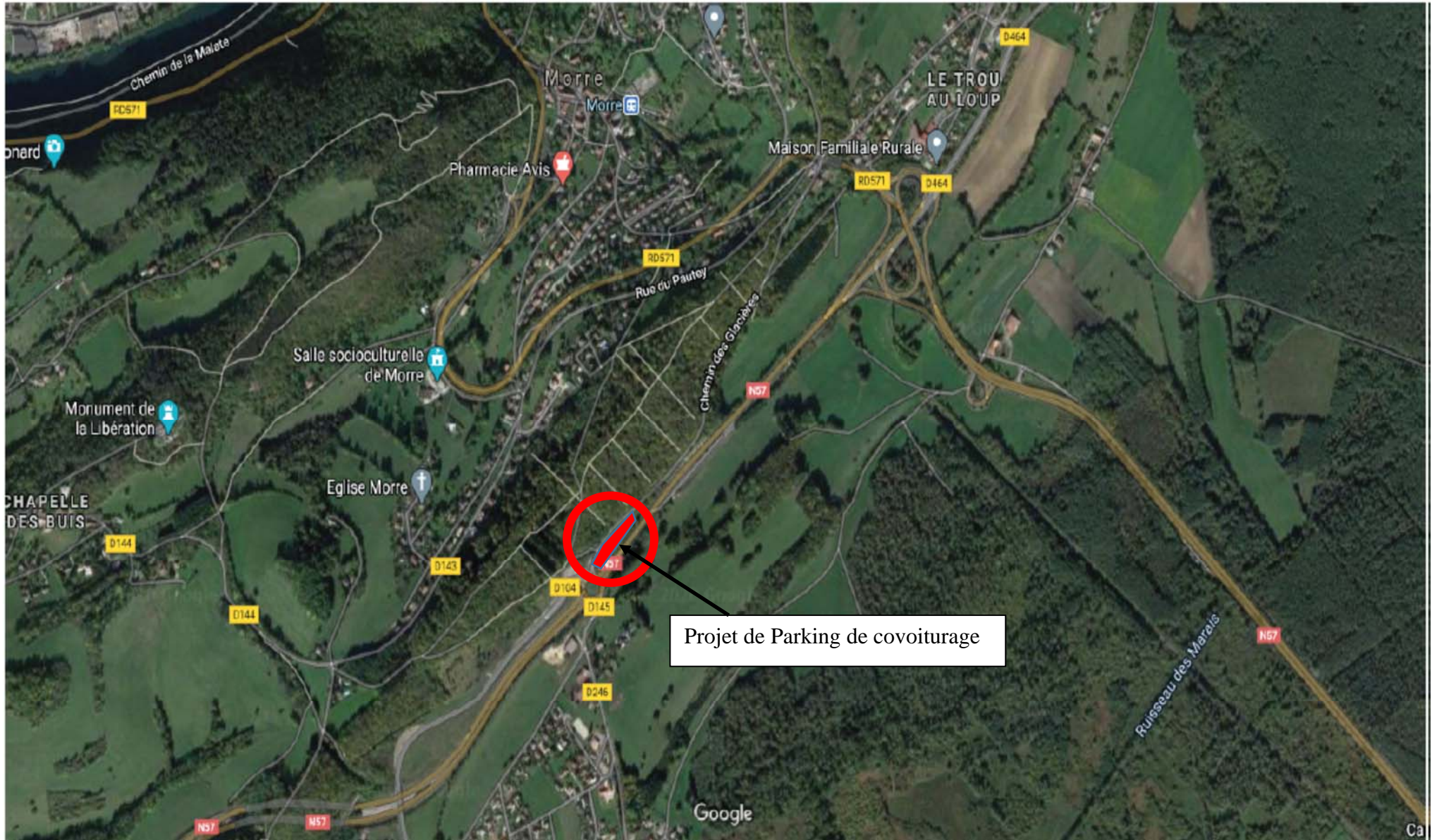
PLAN DE SITUATION – PARKING COVOITURAGE