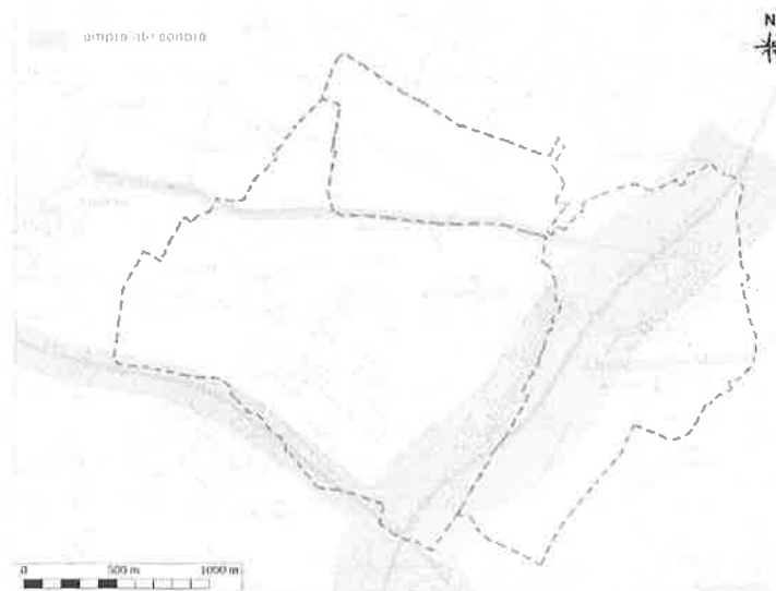
Classement sonore des Infrastructures de transport terrestre