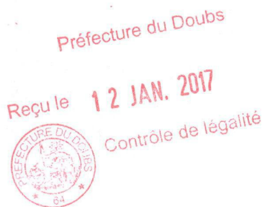
Jean-Louis FOUSSERET, Maire de Besançon.